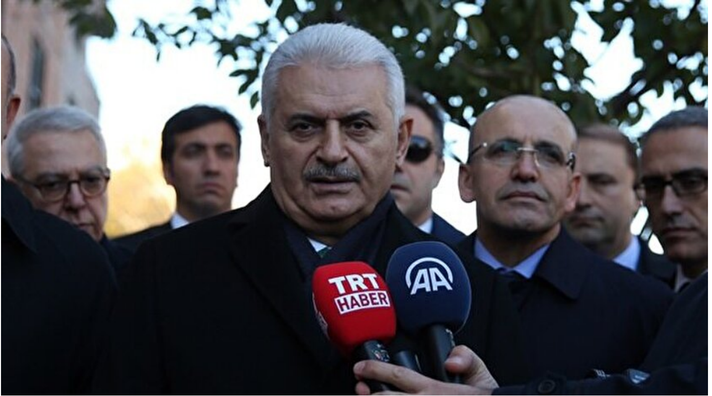
Başbakan Binali Yıldırım