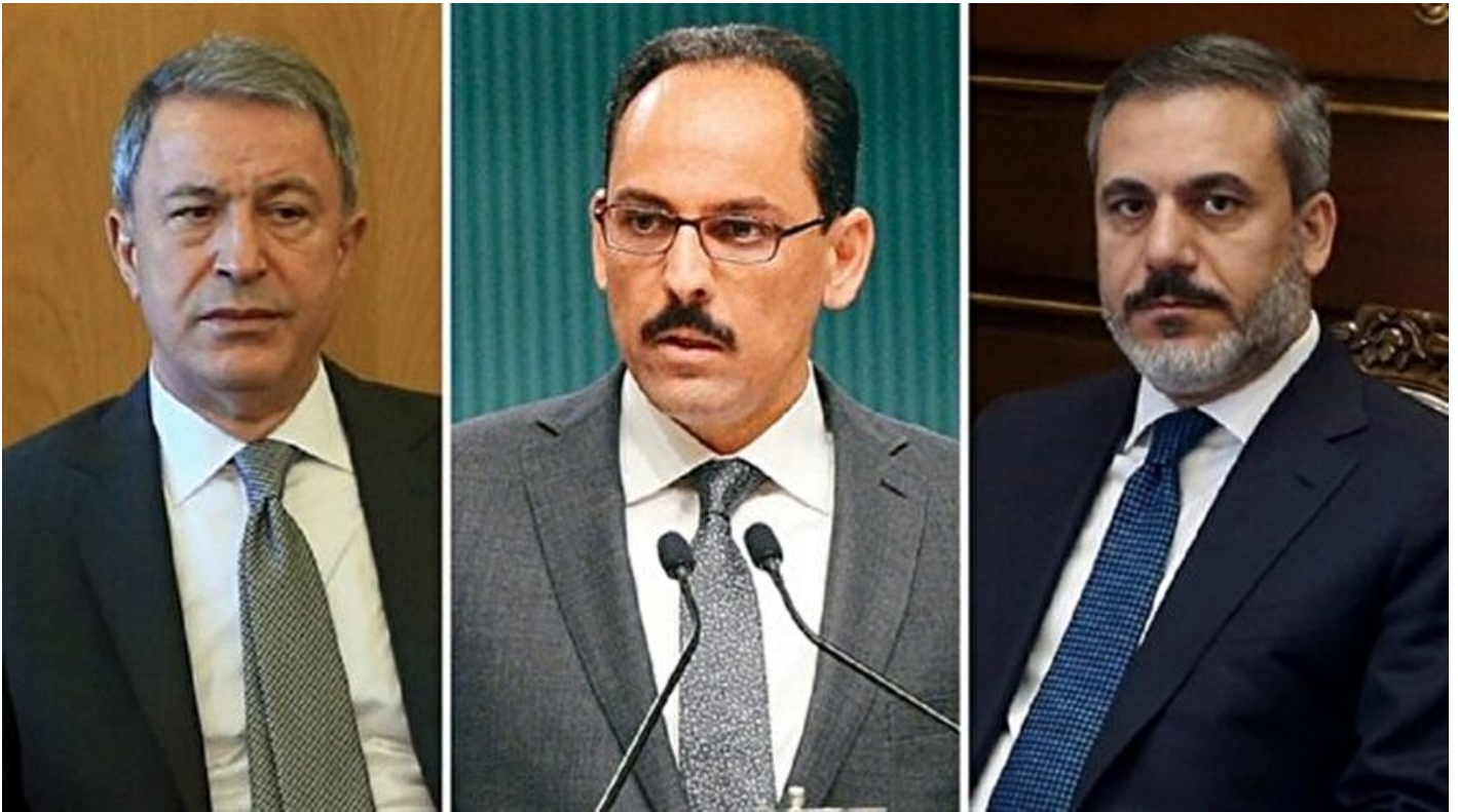
Genelkurmay Başkanı Orgeneral Akar, Cumhurbaşkanlığı Sözcüsü Kalın ve MİT Müsteşarı Fidan