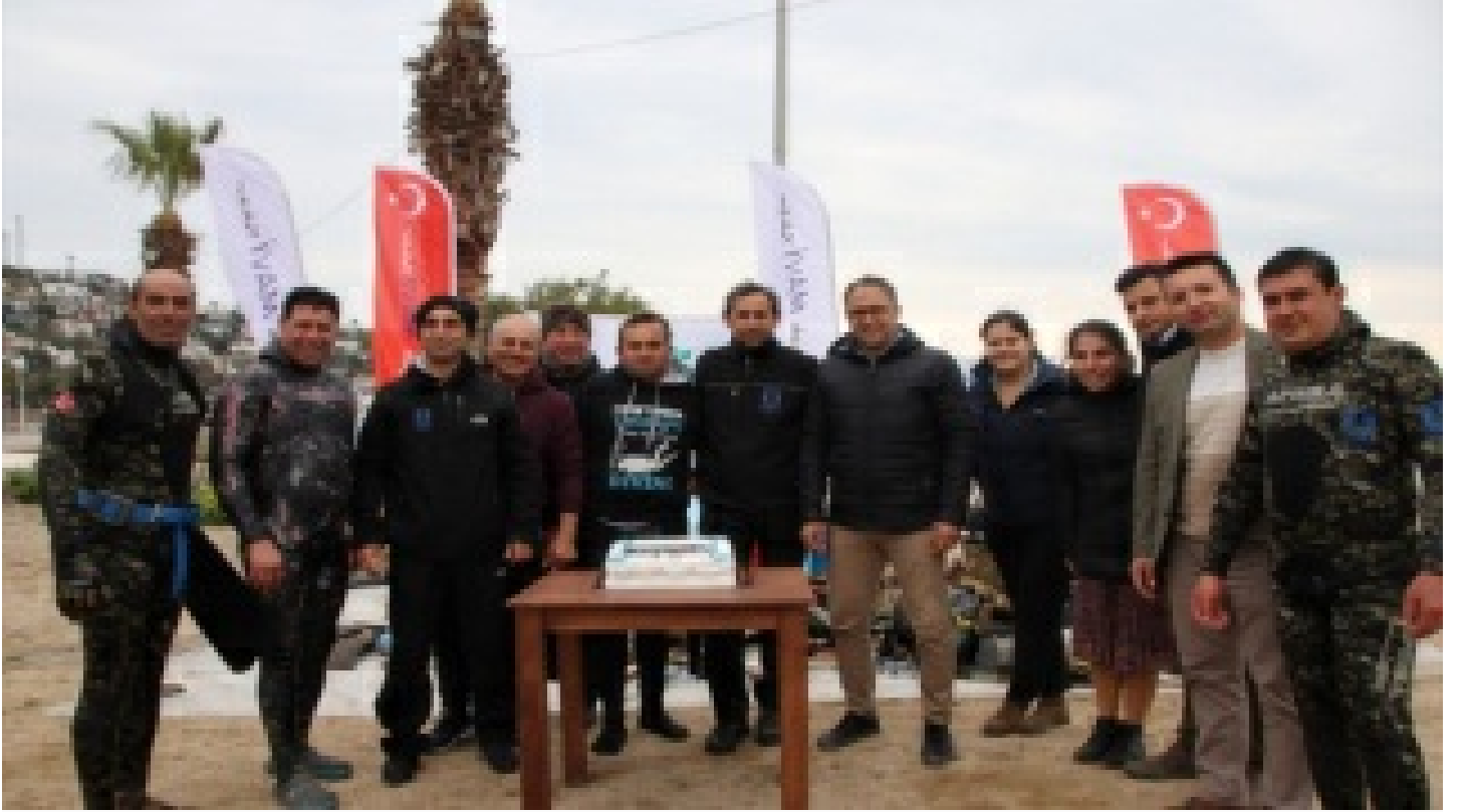
Dalęılar denizi, öęrenciler kıyıyı temizledi