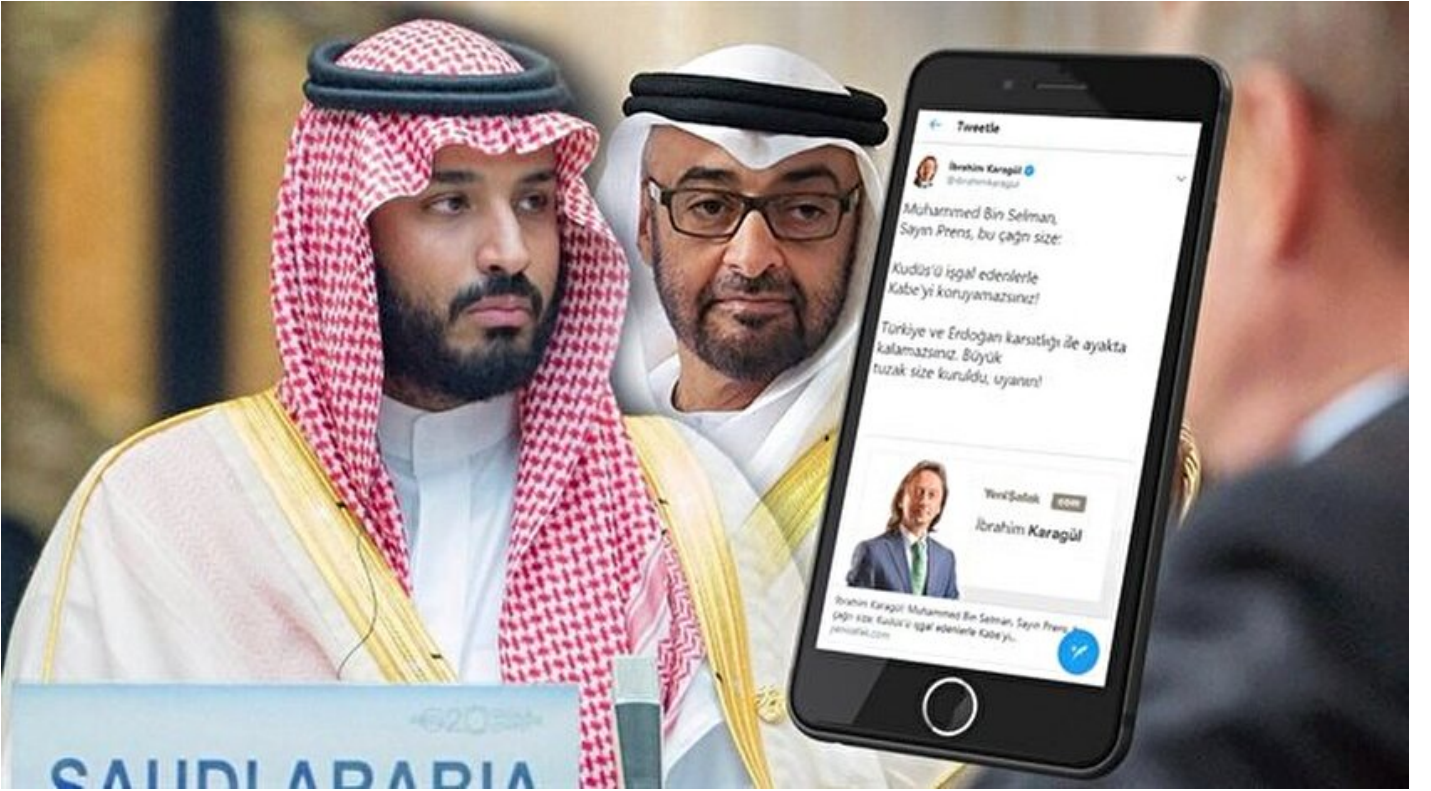
İbrahim Karagül'ün makalesi sonrası BAE destekli çirkin kampanya

Haber Merkezi · 07 Mart 2018, 13:34 · Son Güncelleme: 07 Mart 2018, 16:00 · Yeni Şafak