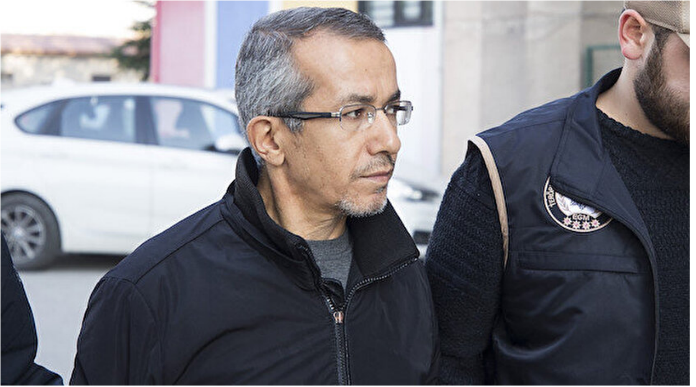
Eski savcı Ferhat Sarıkaya

Haber Merkezi · 02 Haziran 2019, 11:48 · Son Güncelleme: 02 Haziran 2019, 11:56 · AA