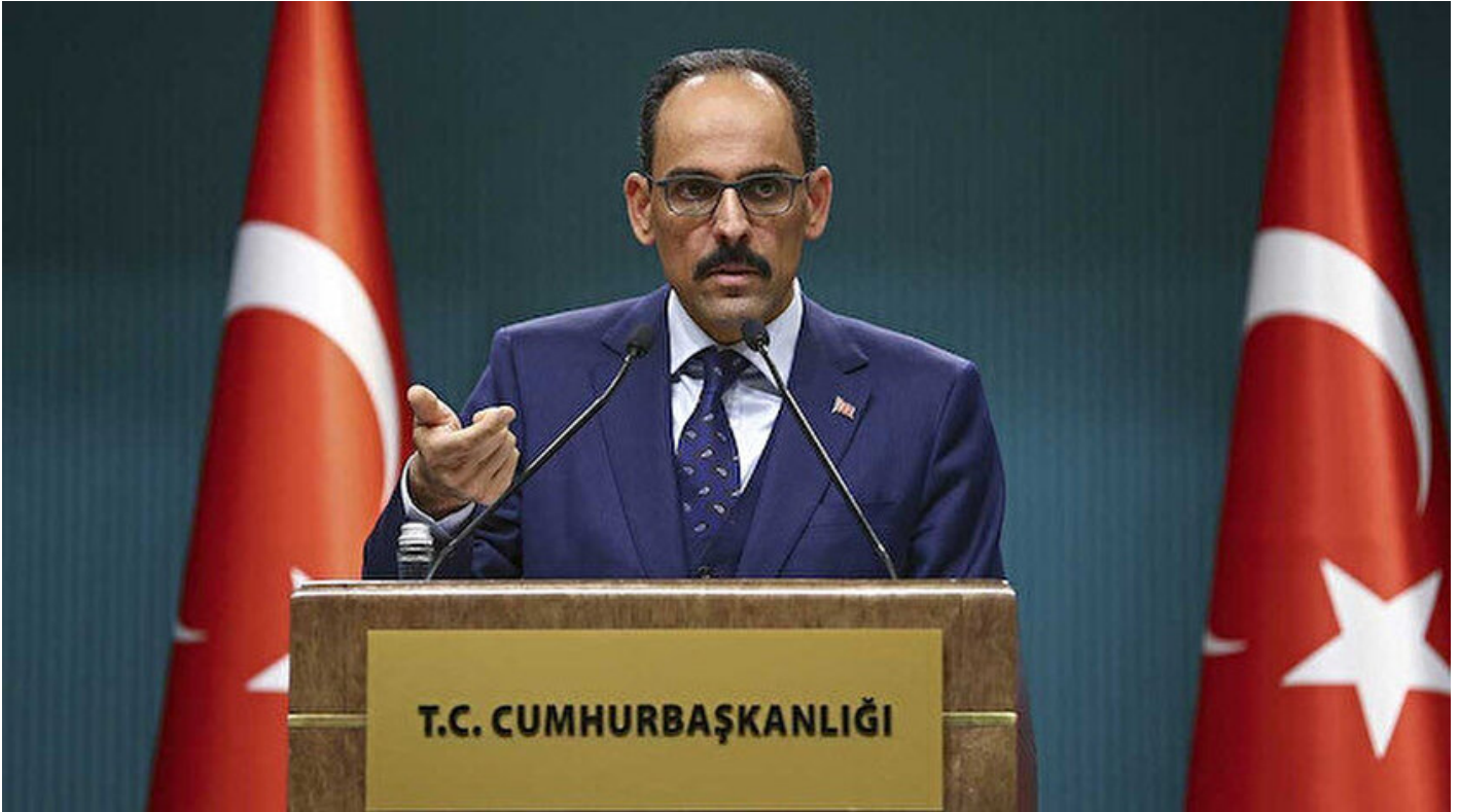
Cumhurbaşkanlığı Sözcüsü İbrahim Kalın

Haber Merkezi · 15 Temmuz 2020, 10:07 · Son Güncelleme: 15 Temmuz 2020, 10:16 · AA