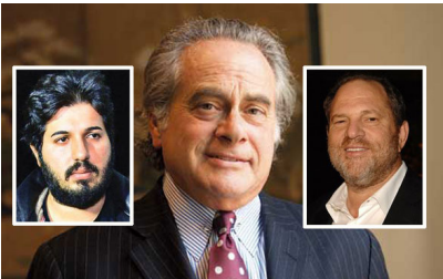
Reza Zarrab'ın avukatı bakın kiminle anlaştı?