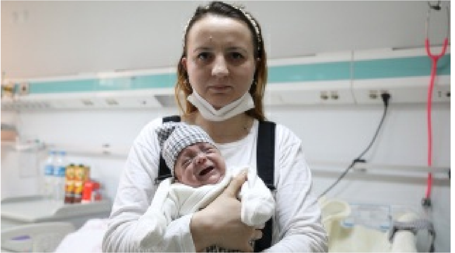
Hayata 600 gramla başladı