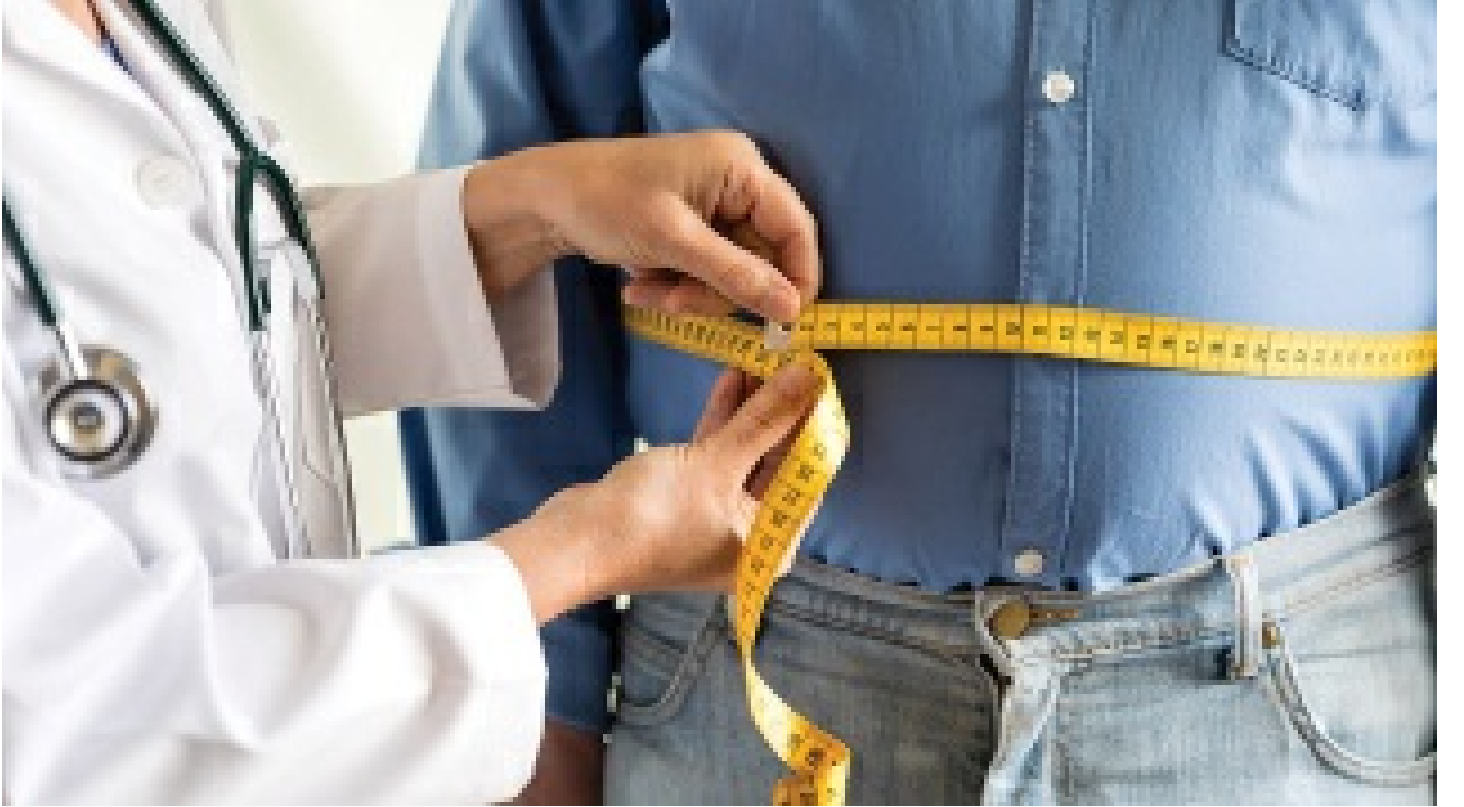
Kovid-19 salgını obeziteyi de artıracak