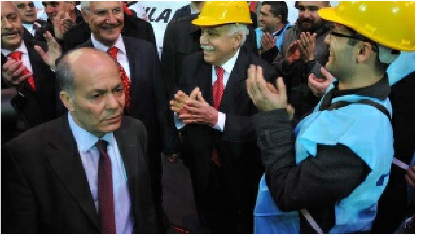
'Sonsuz Nöbetçi'yi arkadaşları anlattı: Parti'nin vicdanı ve neşesiydi