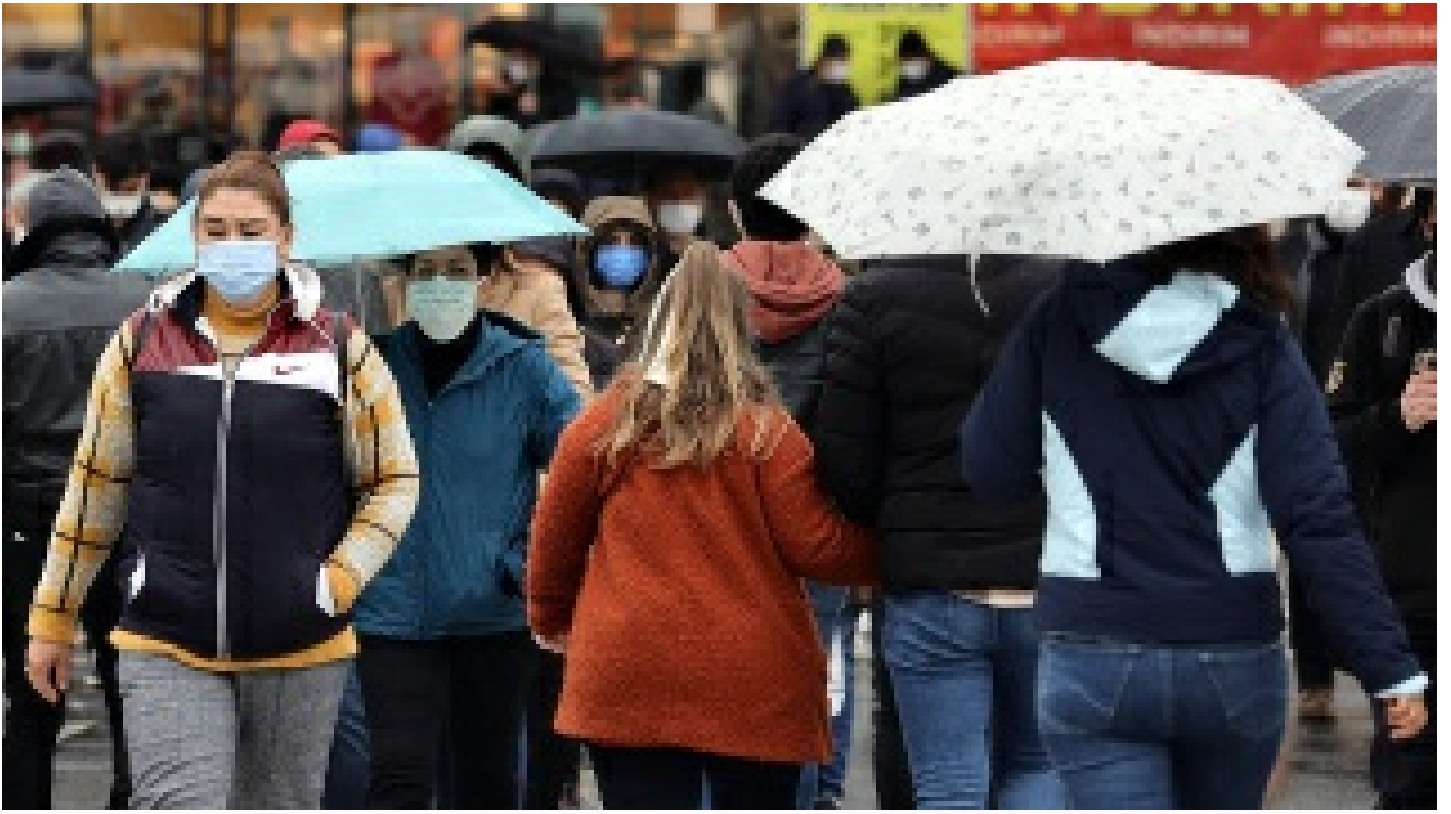
Mesafe yoksa açık alanda da maske