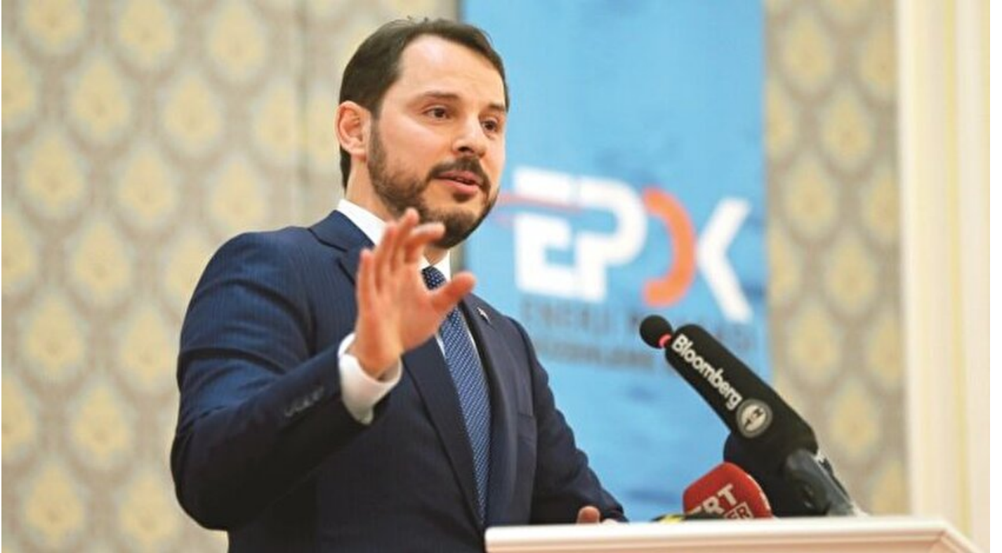
Enerji ve Tabii Kaynaklar Bakanı Berat Albayrak

Haber Merkezi · 23 Şubat 2017, 04:00 · Son Güncelleme: 23 Şubat 2017, 05:05 · Yeni Şafak