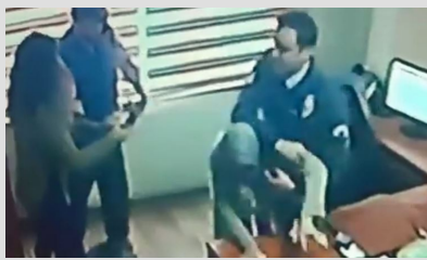
Yardım istedi, darbedilerek dışarıya atıldı