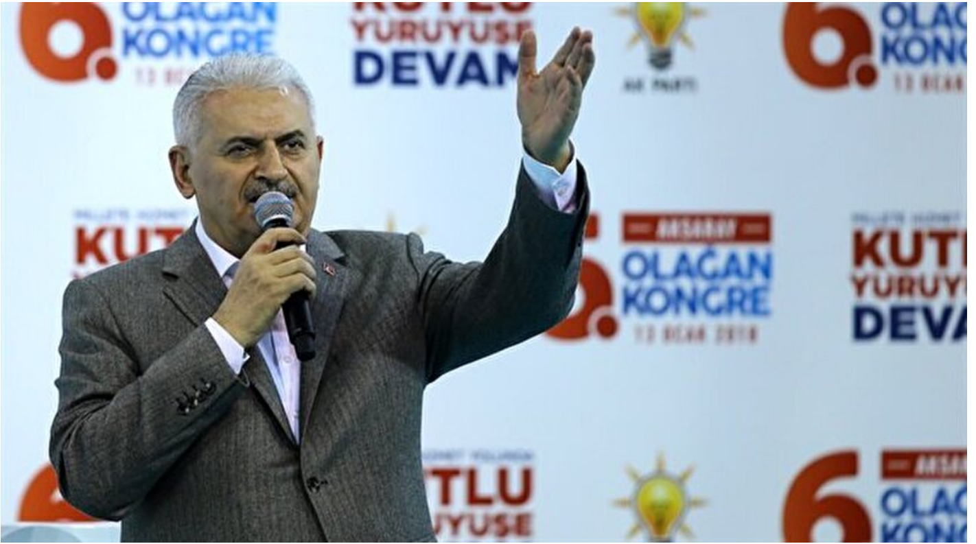
Başbakan Binali Yıldırım