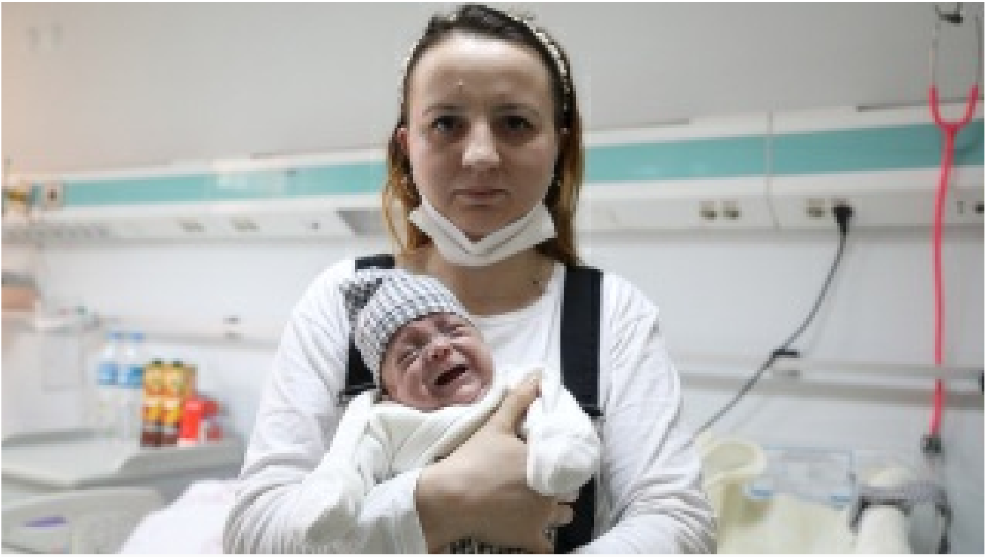
Hayata 600 gramla başladı