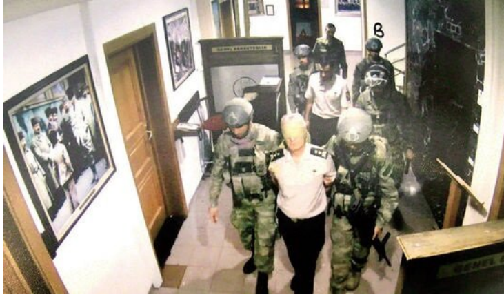
1- Eski Genelkurmay Harekat Plan Daire Başkanı Tümgeneral Baki Kavun:

YALAN: Darbecileri eylemlerinden vazgeçmeleri için ikna etmeye çalıştım. Darbeci Özel Kuvvetler personeli ellerimi ve gözleri bağlayarak beni derdest etti.