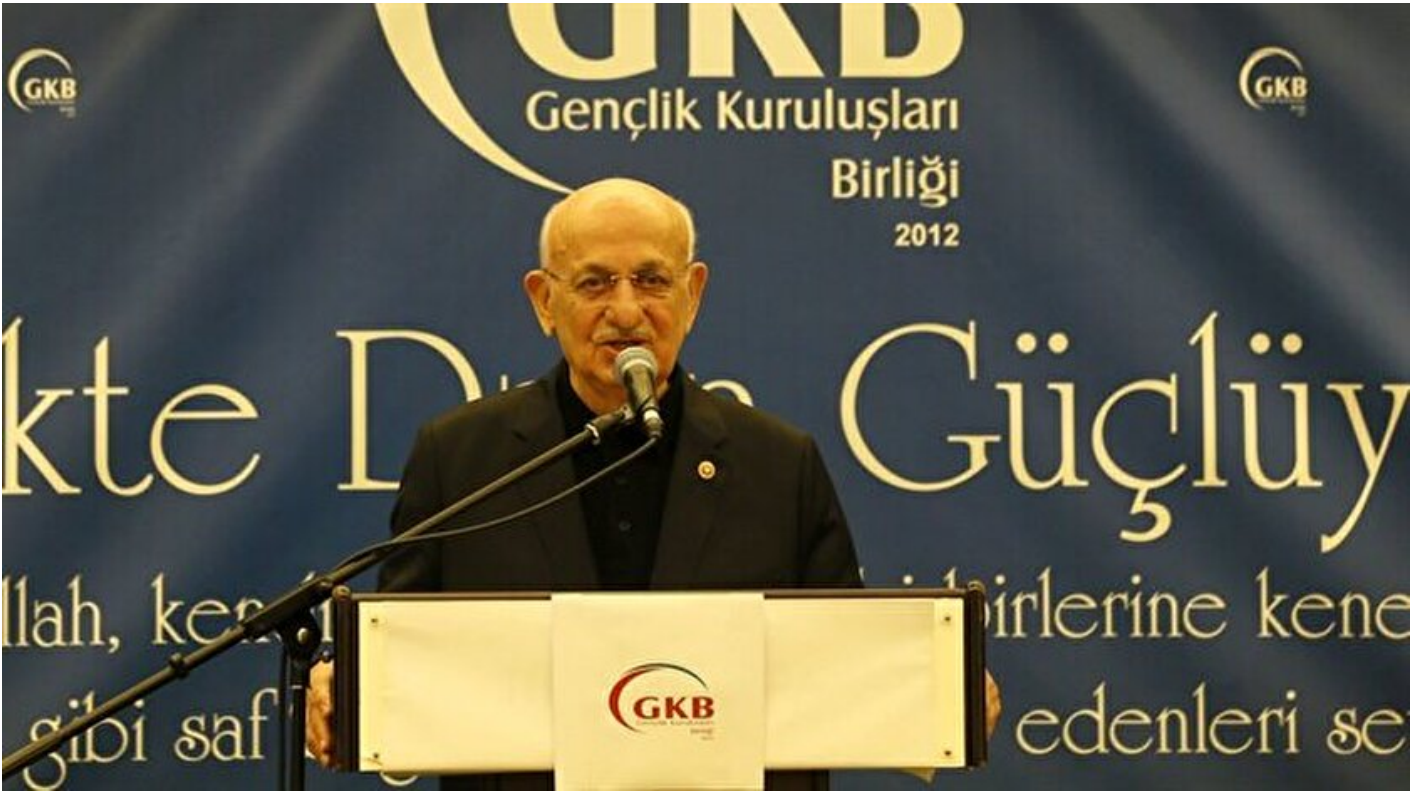
TBMM Başkanı Kahraman

Haber Merkezi · 18 Haziran 2017, 18:24 · Son Güncelleme: 18 Haziran 2017, 18:26 · AA