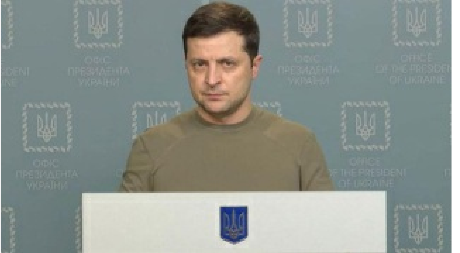
"Zelenskiy ABD'nin Varşova Büyükelçiliği'nde"