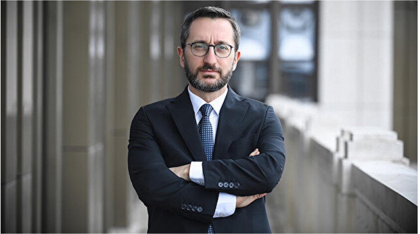
Cumhurbaşkanlığı İletişim Başkanı Fahrettin Altun.

Haber Merkezi · 01 Şubat 2019, 10:30 · Son Güncelleme: 01 Şubat 2019, 10:37 · AA