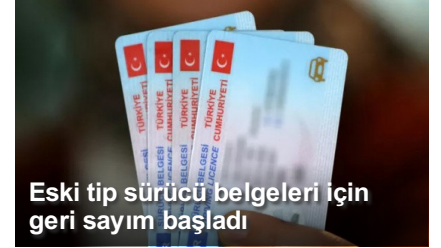
Eski tip sürücü belgeleri için geri sayım başladı