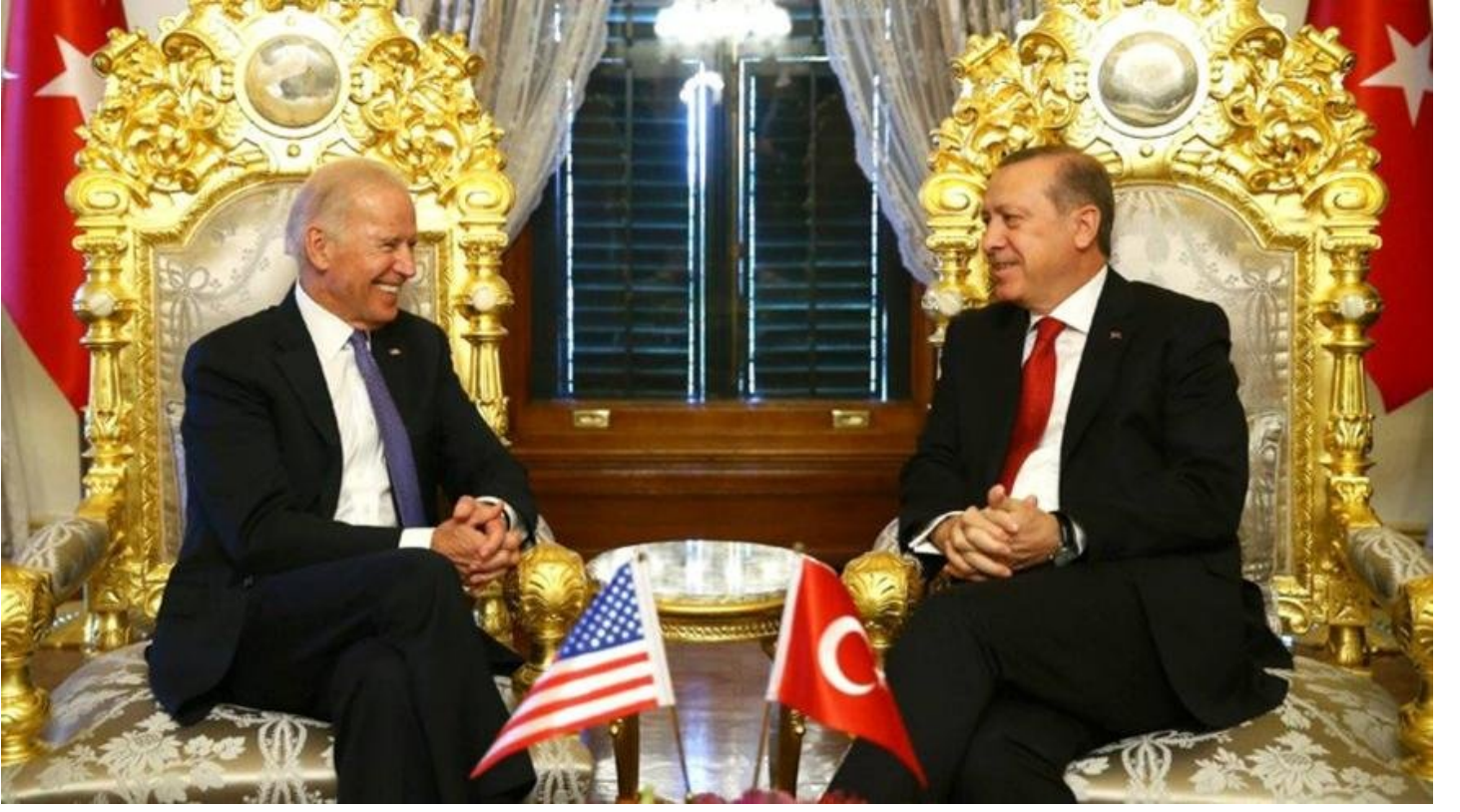
ABD Başkanı Barack Obama döneminde Başkan Yardımcısı olarak görev alan Joe Biden, Erdoğan'ı ziyaret etmişti.