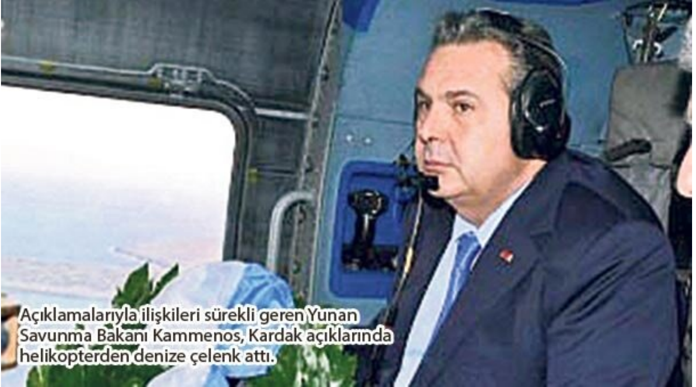
Yunanistan Savunma Bakanı Panos Kammenos

Erdoğan, 3. Cumhurbaşkanı Celal Bayar'ın 1952'deki Yunanistan ziyaretinden 65 yıl sonra Cumhurbaşkanı düzeyinde Yunanistan'a ilk resmi ziyarette bulundu. Bu ziyaretin gündem maddeleri arasında; ticaret hacminin 10 milyar dolara çıkarılması, İstanbul-Selanik hızlı treni ile İzmir-Selanik gemi seferleri projeleri yer aldı. İki ülke arasında Ege ile Doğu Akdeniz'deki ihtilaflar ile azınlıklarla ilgili sorunların geliştirilen ilişkilerin yaratacağı olumlu atmosfer içinde düşük gerilimde tutulmasına yönelik bir anlayış öne çıktı.