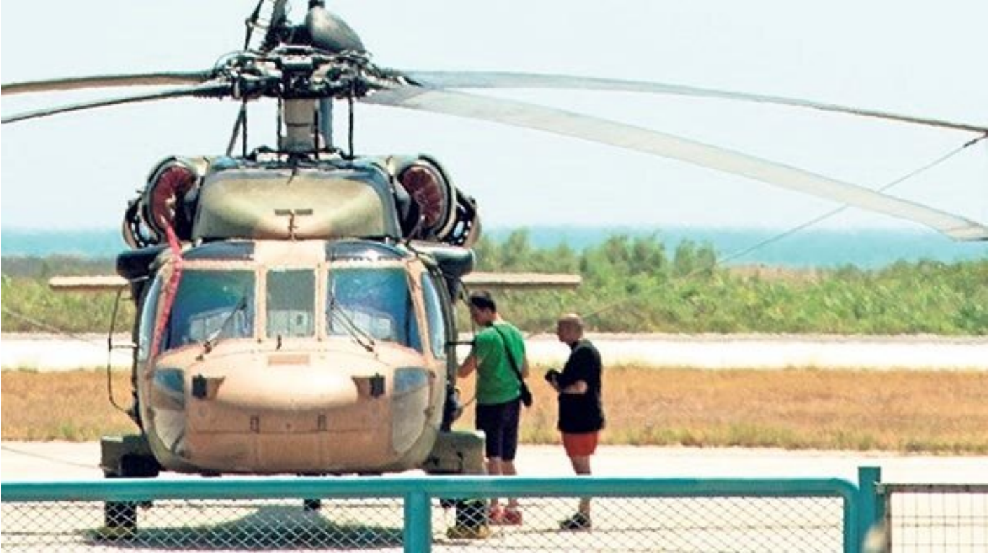
FETÖ'cüler helikopterle Yunanistan'a kaçtı

Kaş'ın hemen karşısındaki bölgelerde tatbikat başlattı. Kıbrıs çevresindeki münhasır ekonomik bölgelerle ilgili olarak da, KKTC'nin menfaatleri aleyhine adım atmaya yöneldi. 28 Mart'ta Yunan donanmasının Ege'ye açılarak yaptığı tatbikata, 1821'de Osmanlı Donanması'nı yakan Yunan korsanlarının kullandığı ve "Kundakçı" anlamına gelen "Pirpolidis" adının verilmesi dikkat çekiciydi. Bu süreçte Yunanistan Savunma Bakanı Panos Kammenos'un kışkırtıcı açıklamaları ise ilişkilerin psikolojisini daha da bozdu.