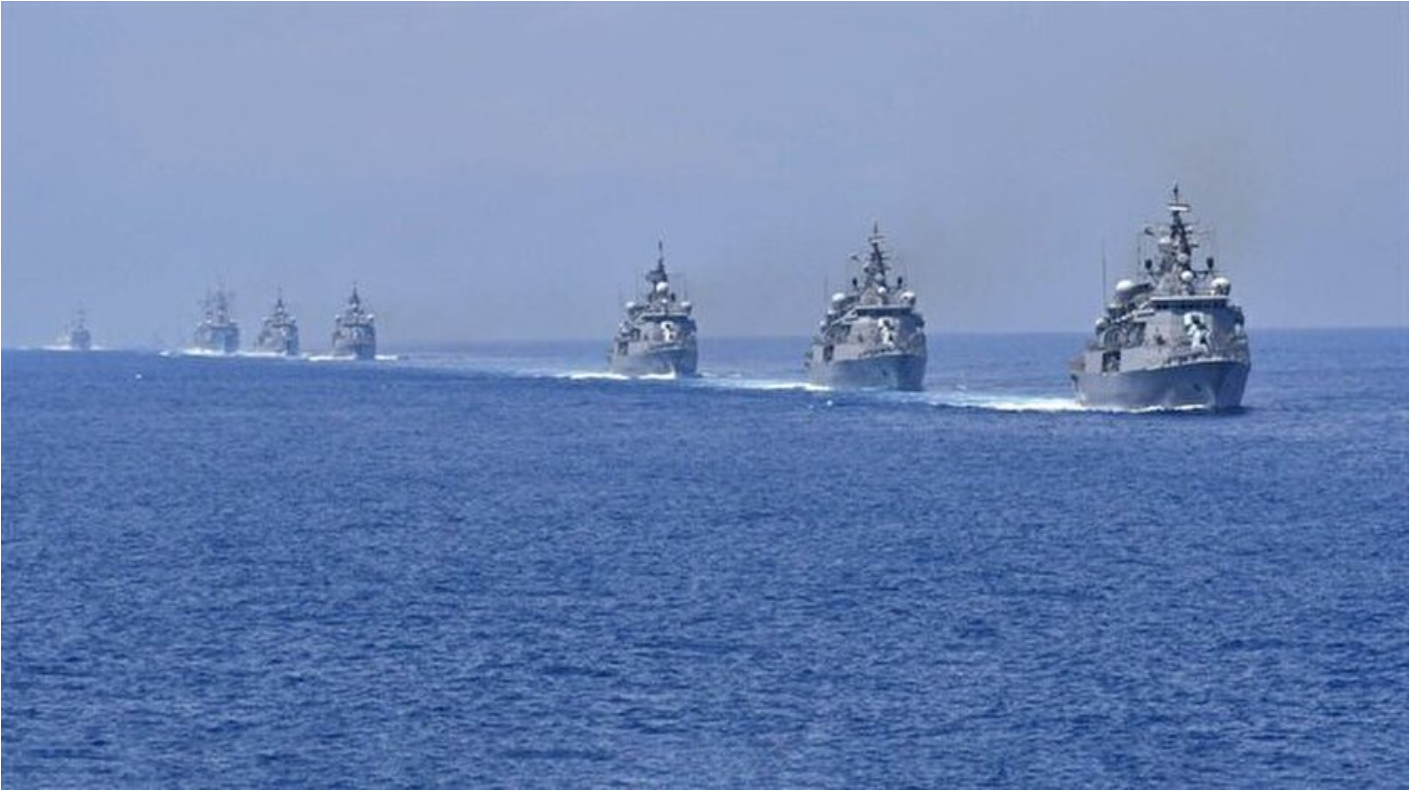
Ege Tatbikatı 2018