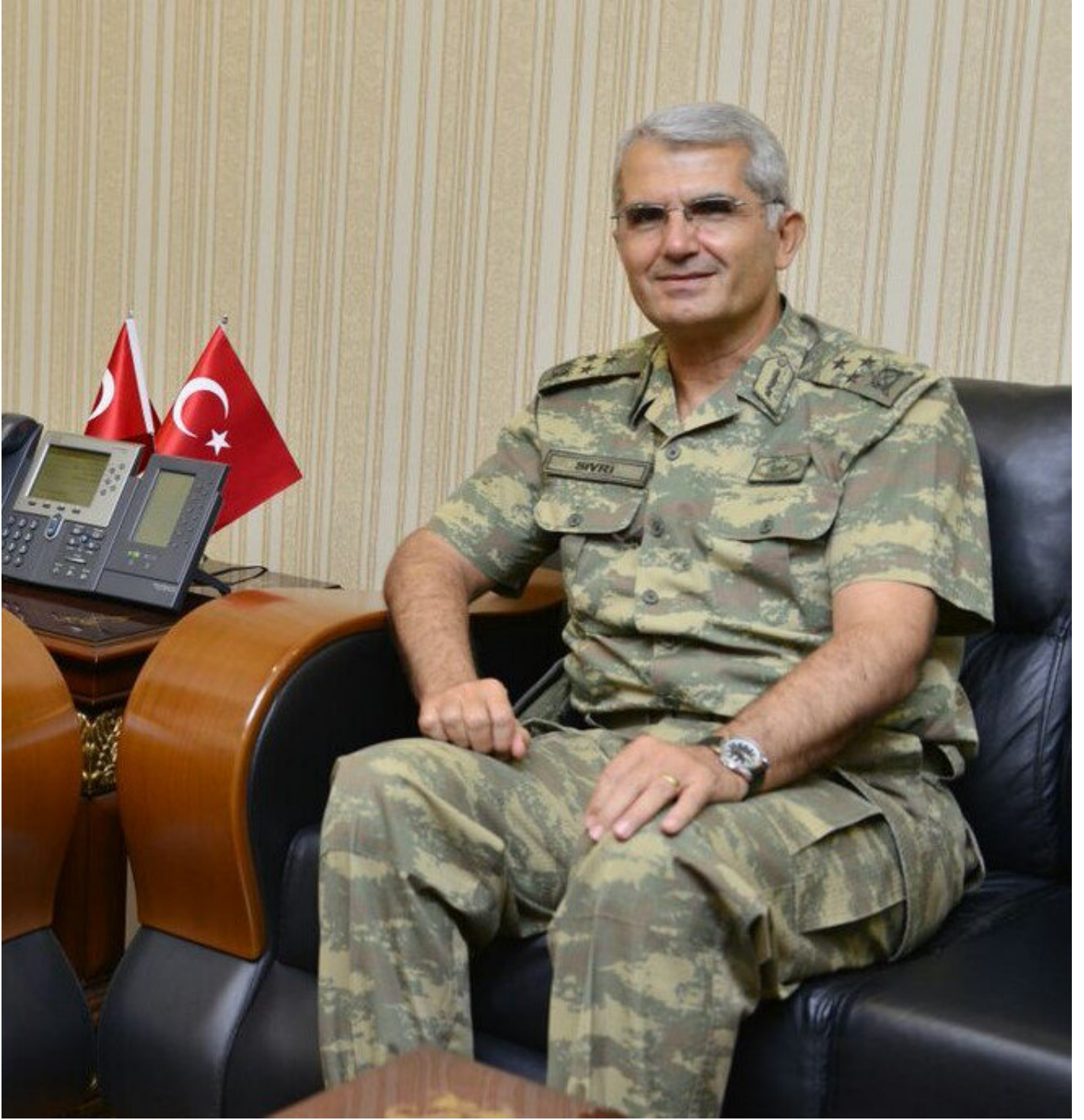
Kolordu Komutanı Korg. Ali Sivri ise Ege Ordu Komutanı oldu.