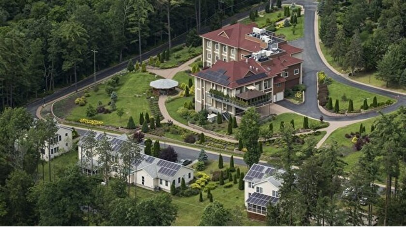
FETÖ elebaşı Gülen'in ABD'deki çiftliği

Haber Merkezi · 21 Mayıs 2018, 11:34 · Son Güncelleme: 21 Mayıs 2018, 16:44 · AA