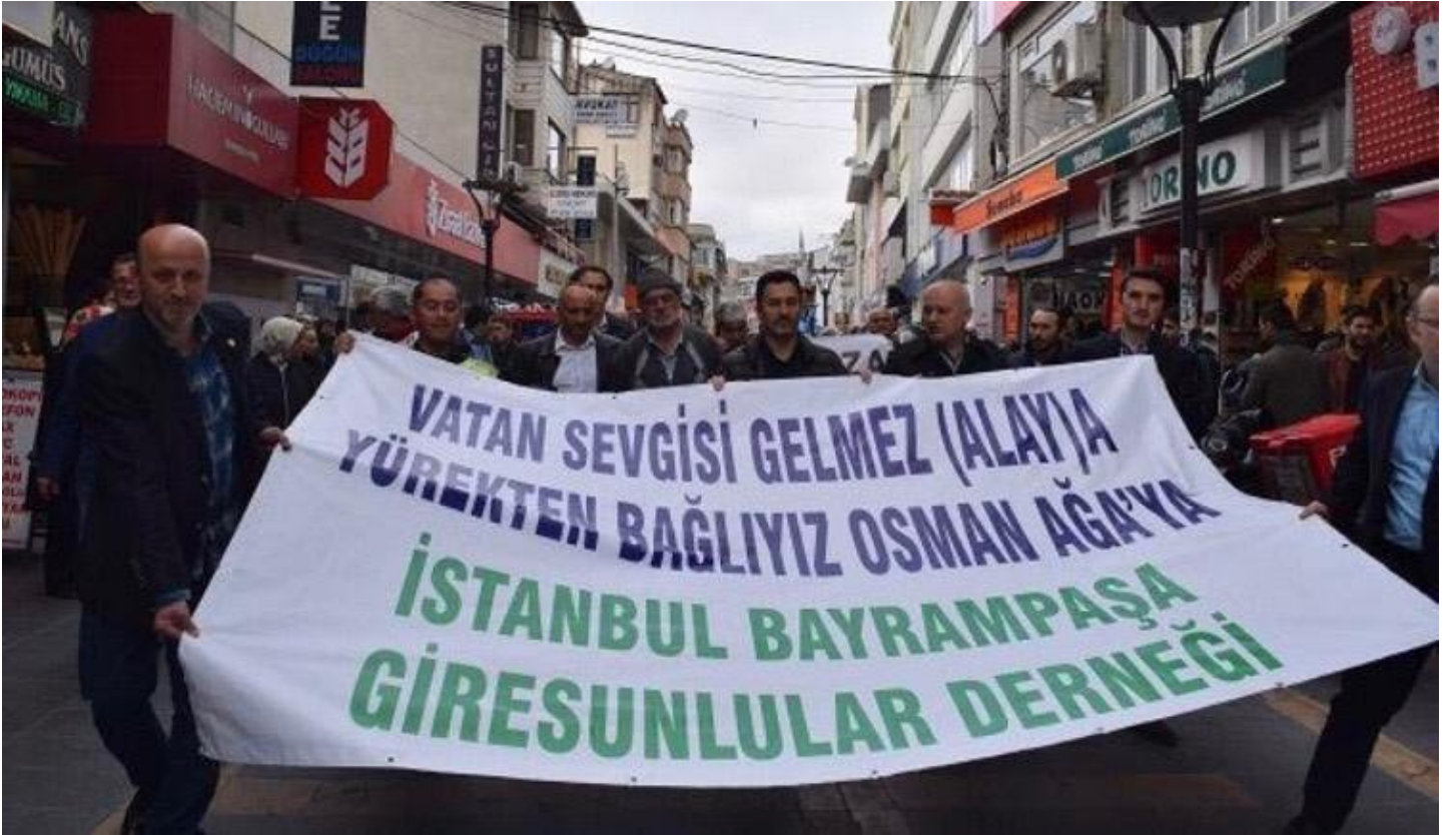
Bayrampaşa Giresunlular Derneği bu pankartı açarak yürüyüş de gerçekleştirdi.

“Topal Osman Ağa vatanın bölünmez bütünlüğü (BEKA için ne gerekiyorsa onu yapmıştır. TRT çalışanlarının içindeki Pontusçu Rumlar Türk milletinin değerlerine yaptığı bu ilk küstahlığı değildir. Şunu anlıyoruz ki, için Topal Osman Ağa'dan yarım kalan işimiz var. Topal Osman Ağa “Vatanın ha ekmeğini yemişim ha uğruna kurşunu” diyerek yola çıkmış milli kahramandır. Türkiye Cumhuriyeti'nin kurucusu Gazi Mustafa Kemal Atatürk'ün yaveri silah arkadaşıdır. Vatan için can alınır, can verilir. Osman Ağa devlet için can alıp can vermiş bir kahramandır. Ruhu şad, mekanı cennet, kabri nur bahçeleri dolsun.”