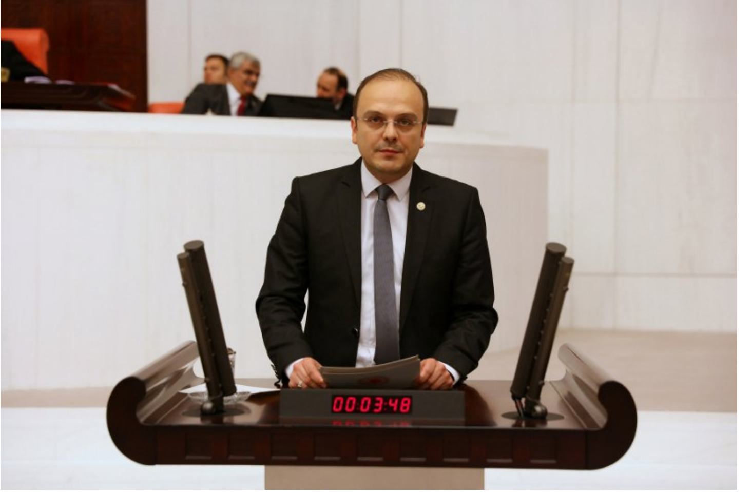
CHP Giresun Milletvekili Necati Tıǒlı