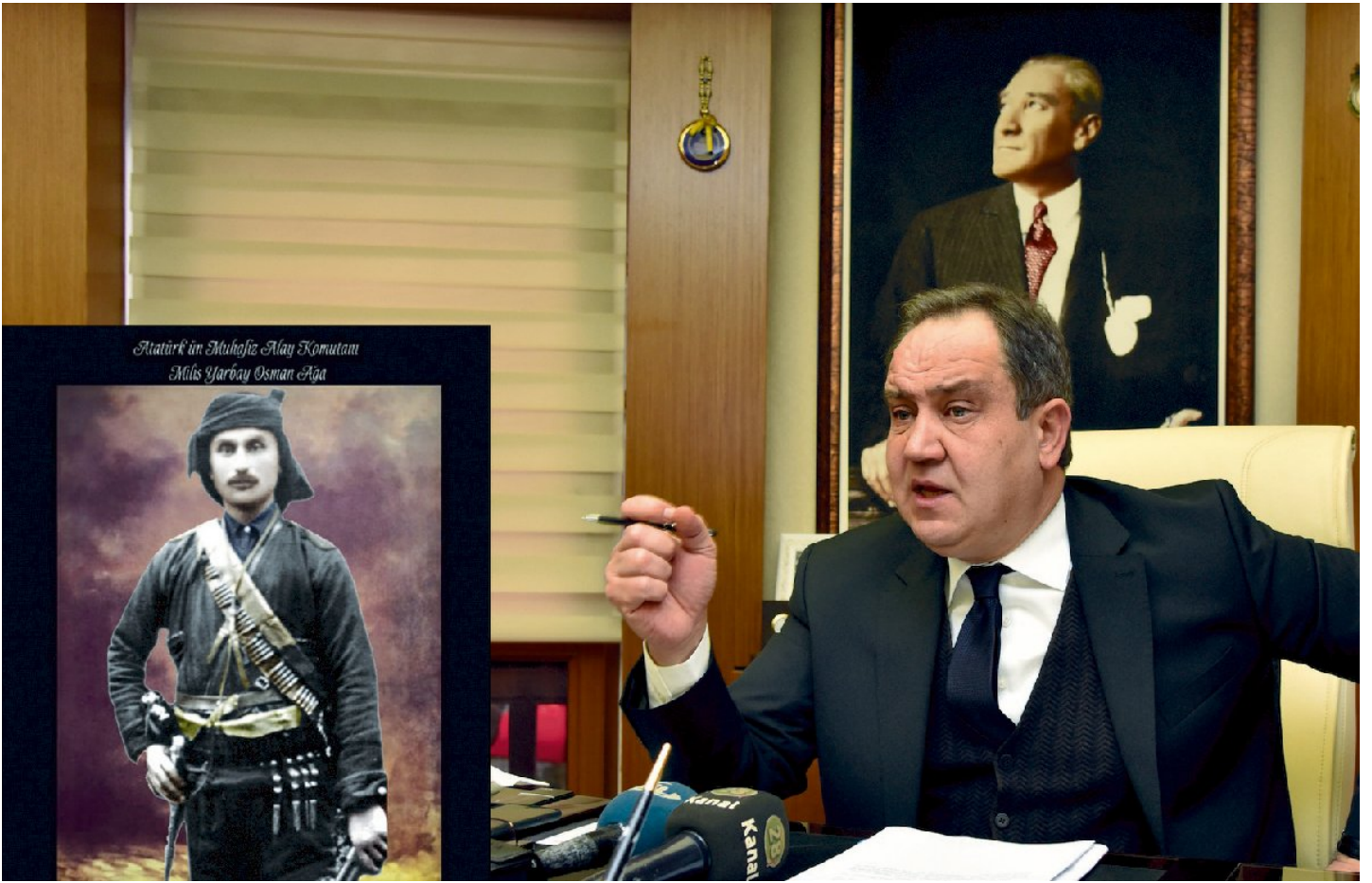
Giresun Belediye Başkanı Kerim Aksu