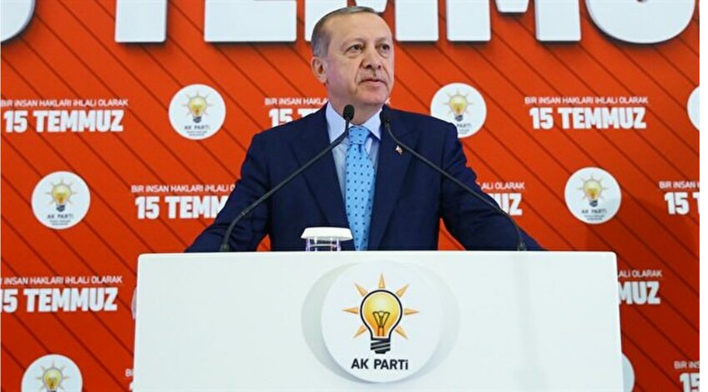
Cumhurbaşkanı Recep Tayyip Erdoğan.

Haber Merkezi · 14 Temmuz 2017, 16:00 · Son Güncelleme: 14 Temmuz 2017, 16:45 · Yeni Şafak