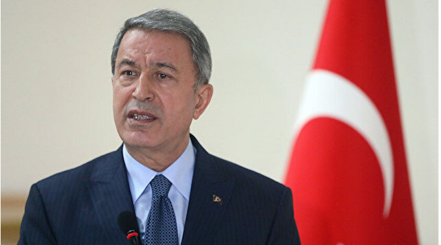
Milli Savunma Bakanı Hulusi Akar