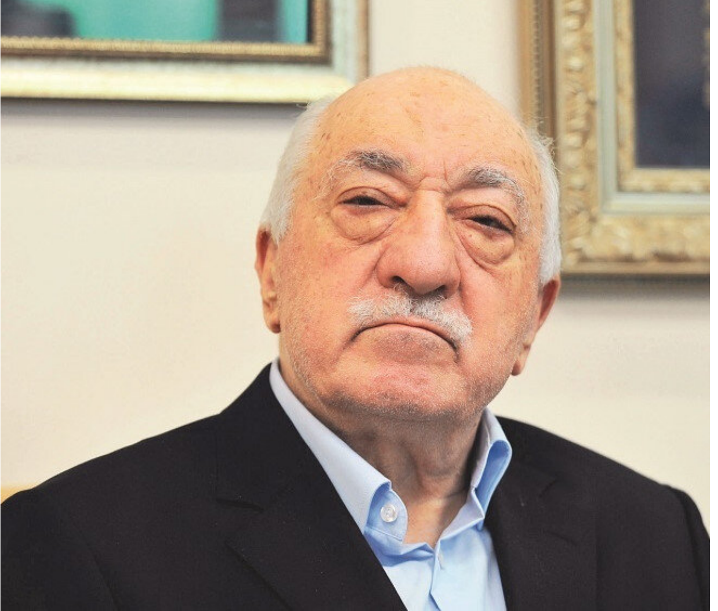
Teröristbaşı Fethullah Gülen

Terörist başının bazı siyasilerin yanlarına eleman yerleştirdiğini hatırlatan Erdoğan, "Gülen bu kişilere, 'Ne emrederse yapın, en yakını olun' diyordu. Türkeş'in yanına da böyle birini yerleştirmiş olabilir. Bu taktiği her zaman kullandı" dedi. Gülen'in bir diğer taktiğini de aktaran Erdoğan, "Gülen'in yakın gibi görünüp cenazesine katıldığı çok insan var. Tanınmış değiller, cemaat içerisindeki kişilere bunu çok yapardı. Cemaatteki kişilerin arkasından atar tutar sonra da yüzlerine hiçbir şey söylememiş gibi yakın davranırdı" diye anlattı.