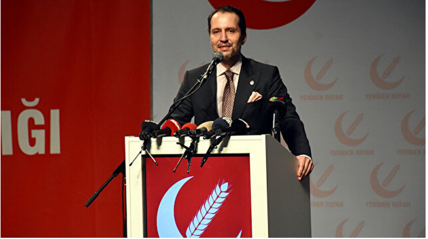
Yeniden Refah Partisi Genel Başkanı Fatih Erbakan.