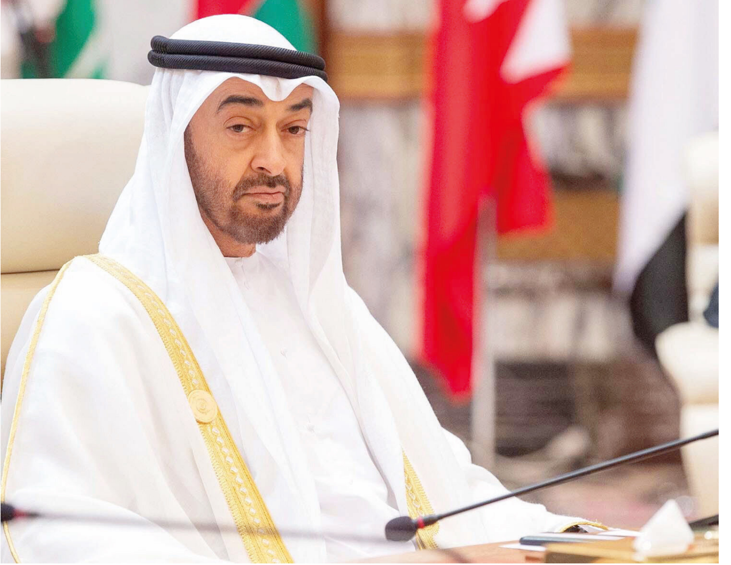
Muhammed bin Zayed

nükleer reaktörünün Abu Dabi'deki Baraka istasyonunda başarıyla devreye alındığını alenen duyuruyoruz. Uzmanlar nükleer yakıtı yüklemeyi, kapsamlı testleri yapmayı ve devreye alma işlemini başarıyla tamamladı" diye yazdı. Maktum, nükleer santrallerin ve BAE'nin yürüttüğü uzay araştırmalarının, 'Arapların bilimdeki yollarını yeniden yakalama ve diğer büyük uluslarla rekabet etme yeteneğine sahip olduklarına dair dünyaya bir mesaj olduğunu' savundu.