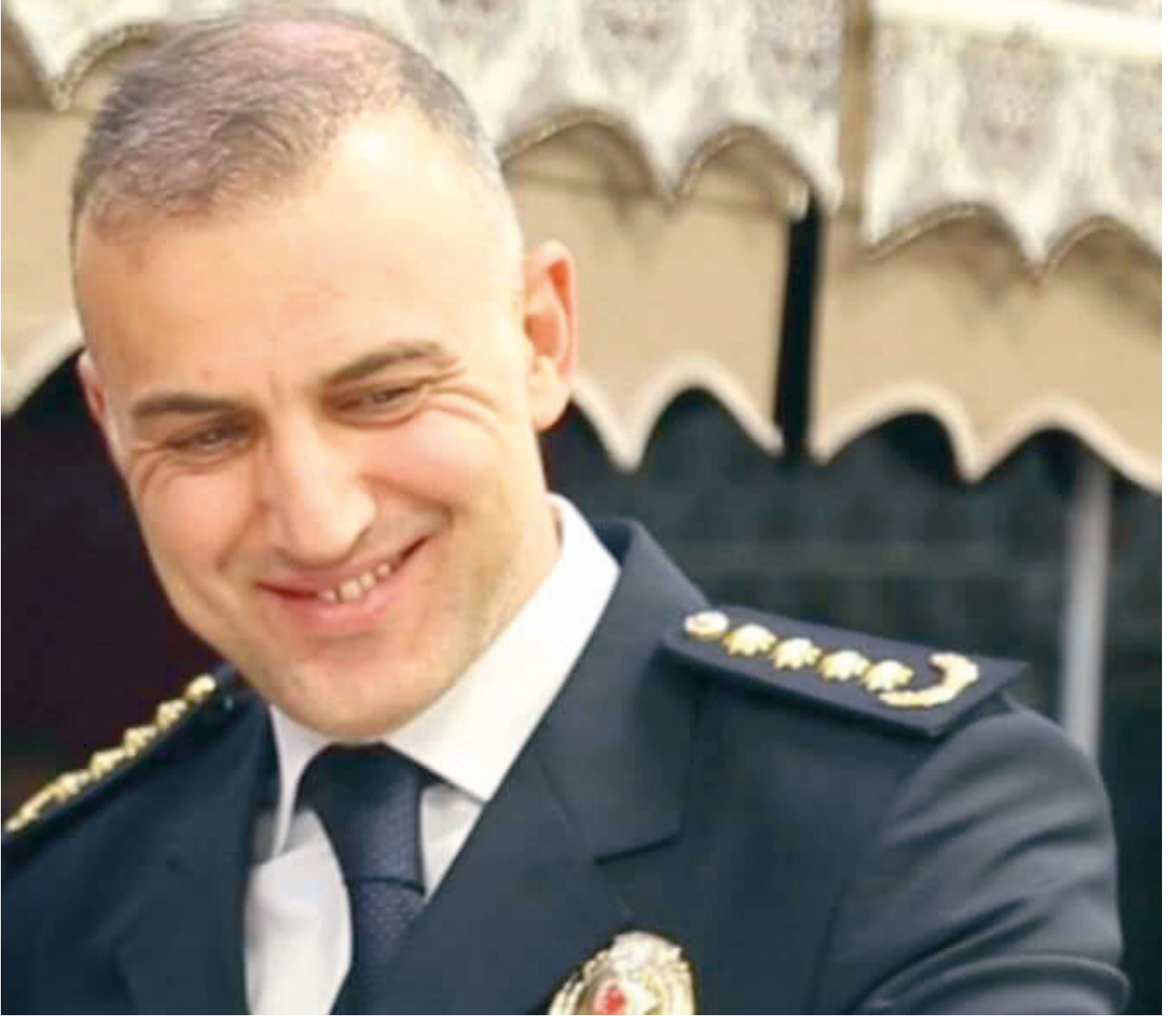
Rize Emniyet Müdürü Altuğ Verdi

Soruşturma birimlerinden edinilen bilgilere göre Saraçoğlu, FETÖ bağlantısını aynı koşuhta farklı bir suçtan yatan isme anlattı. Koşu arkadaşının soruşturma kapsamında 'tanık' sıfatıyla ifadesi alındı. Koşu arkadaşının daha önce savcılığın deşifre ettiđi bir mahrem imamı soruşturma birimleriyle paylaşması üzerine bu kişinin ifadeleri tatmin edici bulundu. Adli Tıp'ın 'akıl sađlığı yerinde' raporu verdiđi Saraçoğlu'nun, cinayet öncesi telefonuna bazı notlar kaydettiđi, bu notlarda kendisini psikolojik sorunlu göstermeye çalıştığı, cinayet sonrası mahkeme sürecinde 'akıl hastası' süsüyle hapisten kurtulmak istediđi belirtiliyor.