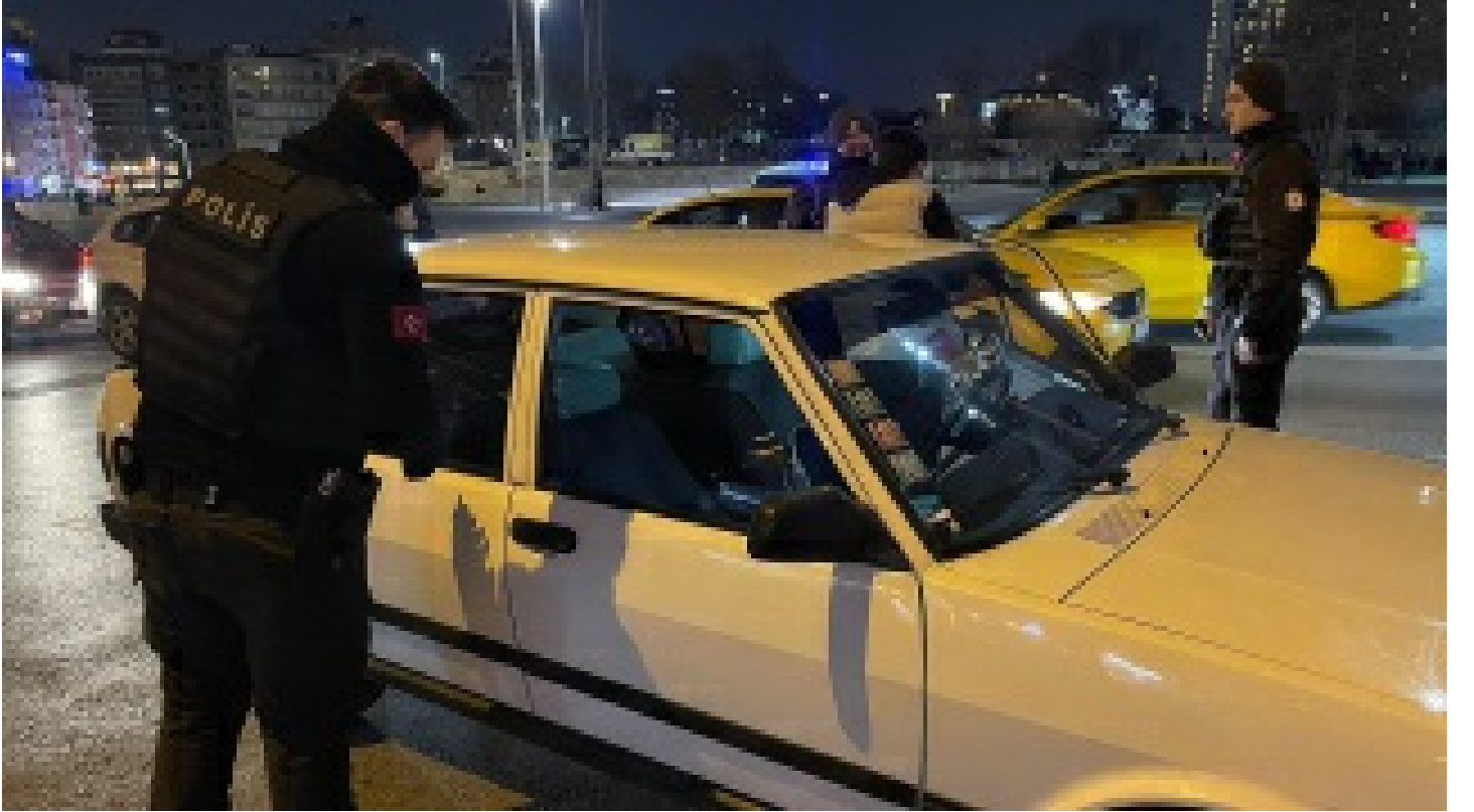
İstanbul'da "Yeditepe Huzur" asayiş uygulaması