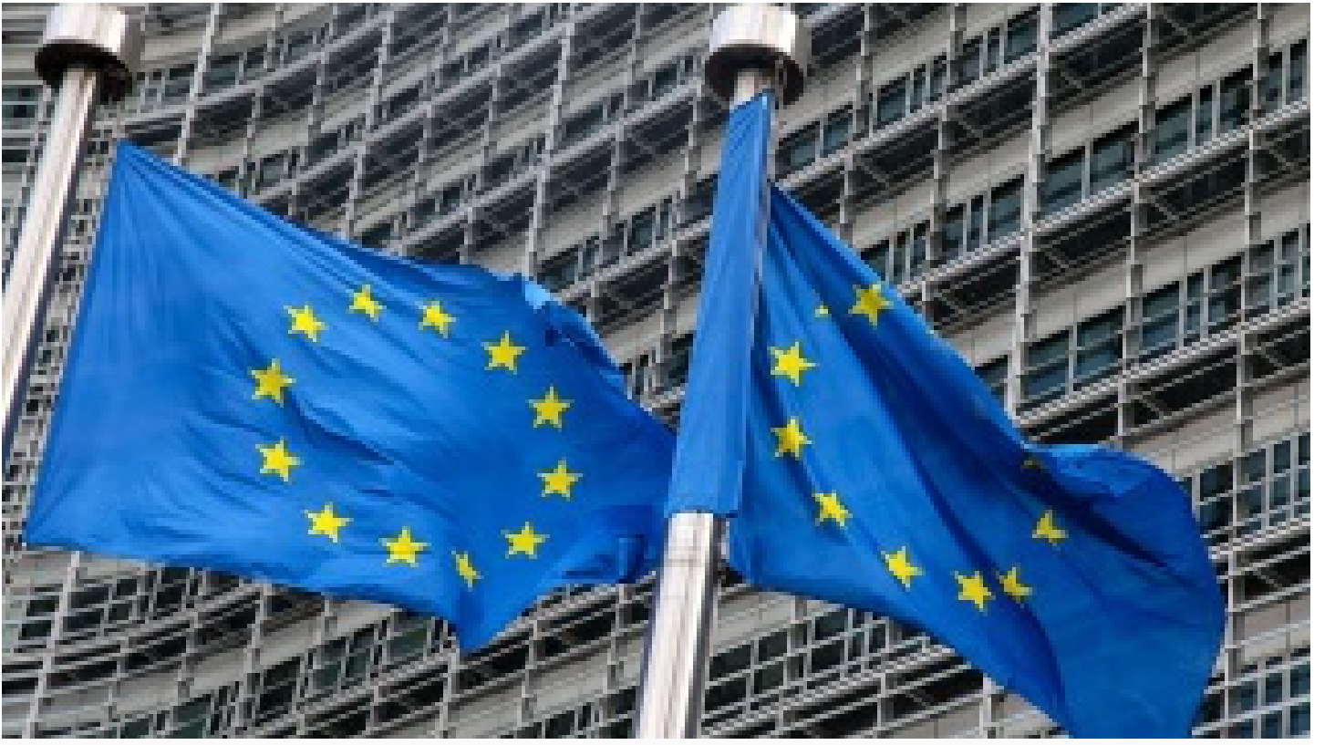
AB'den Belarus'a yaptırımlar artıyor