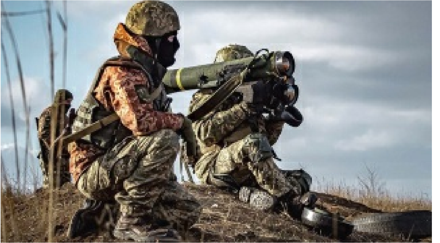
İsveç'ten Ukrayna'ya 'kural dışı' askeri yardım