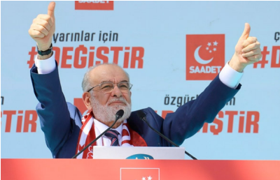
Saadet Partisi milletvekili adayları 2018 SP listesi

POLEMİĞE DÖNÜŞMEMELİ: Dikkatimi çeken hususlardan birisi de propaganda gezilerinin polemiğe dönüşmesidir. Ülkemizin giderek büyüyen meseleleri var. Bunların çözümüne odaklanmalı. Adalet mekanizmasında sıkıntı var. Ekonomi başlı başına çok ciddi mesele haline geldi. Eğitim, dış politika sorunlarımız büyüyor. İç ve dış borçlarımız giderek artıyor. İşsizlik büyük bir sorun haline geldi ve giderek de yaygınlaşıyor. Dolar aldı başını gidiyor. Enflasyon rakamları çok yükseldi. Bunların nasıl çözülmesi gerektiği konuşulmalı. Bunlar vatandaşta büyük bir endişe havası yaratıyor ama bu bugünkü şartlar tamamen iktidar partisinin yanlış politikalarından kaynaklanıyor. Doğru politikalar olursa bunlar kısa sürede çözülür. Ekonomimiz, tüketim ekonomisine döndü adeta.. Halbuki problemleri çözmek, üretimi ajandamızın başına koymakla, milli gelirin adil dağılımıyla gelir. ”