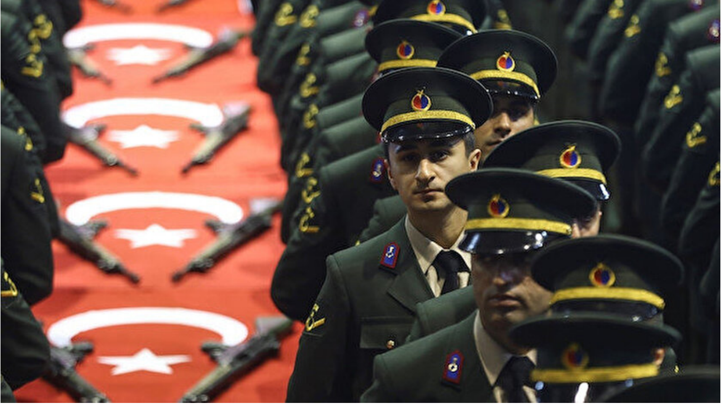
Yemin törenindeki askerler.

Sertaç Aksan · 27 Mayıs 2019, 12:00 · Son Güncelleme: 27 Mayıs 2019, 12:04 · Yeni Şafak