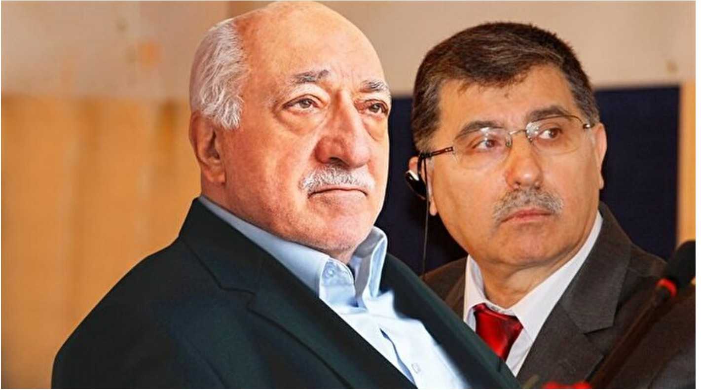
FETÖ elebaşı Fetullah Gülen ve Mustafa Özcan