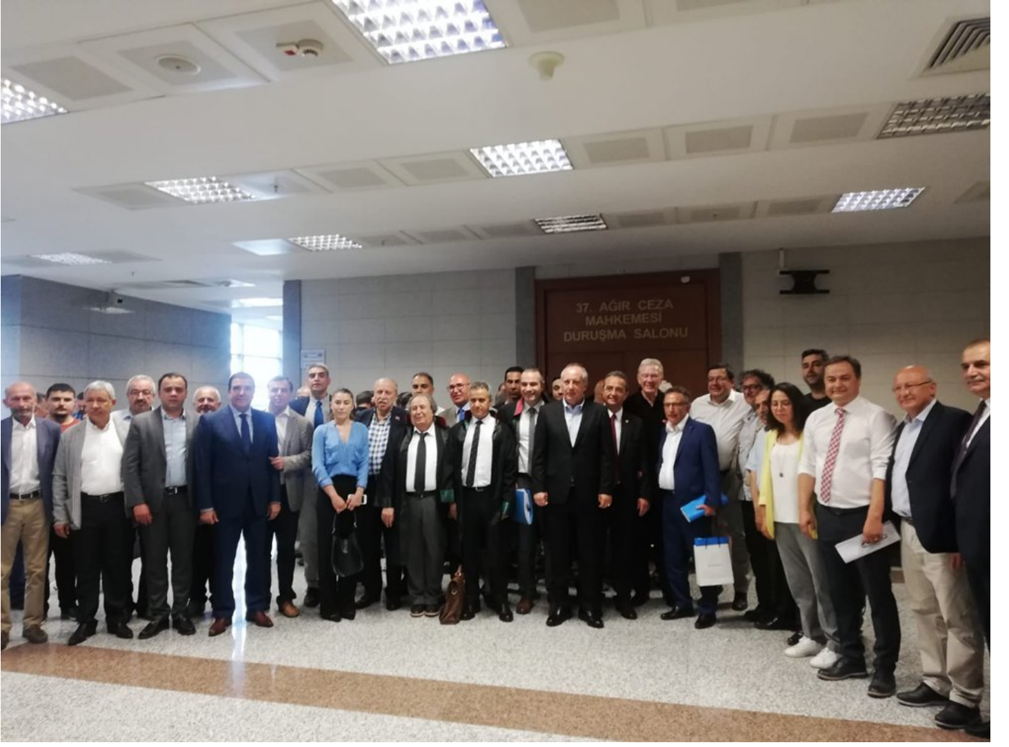
Duruşmaya Sözcü çalışanlarının yanı sıra CHP'li vekiller ve STK temsilcileri de katılıyor.