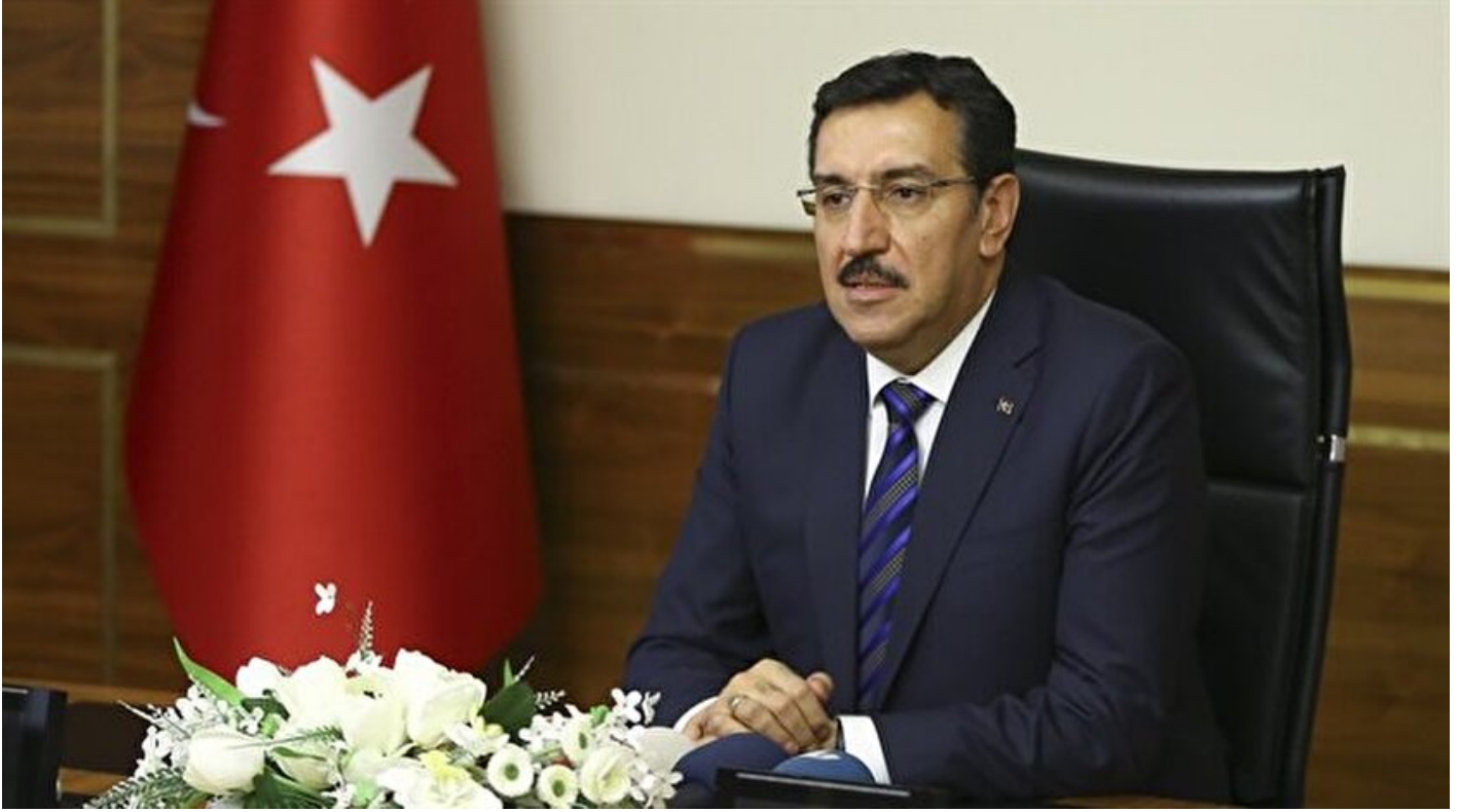
Gümrük ve Ticaret Bakanı Bülent Tüfenkci

Haber Merkezi · 30 Temmuz 2017, 15:26 · Son Güncelleme: 30 Temmuz 2017, 15:31 · AA