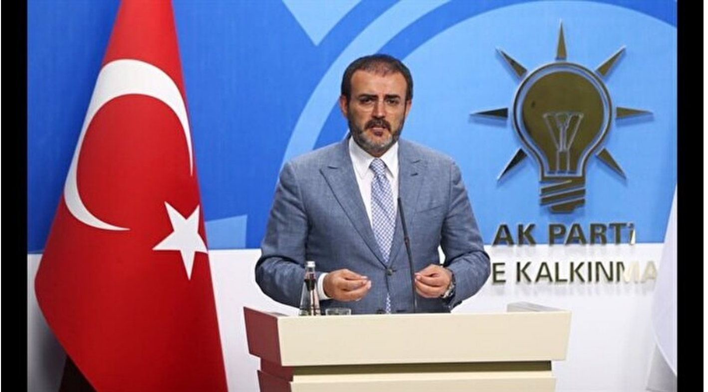
AK Parti Sözcüsü Mahir Ünal

Haber Merkezi · 28 Mart 2018, 12:00 · Son Güncelleme: 28 Mart 2018, 12:03 · Diğer