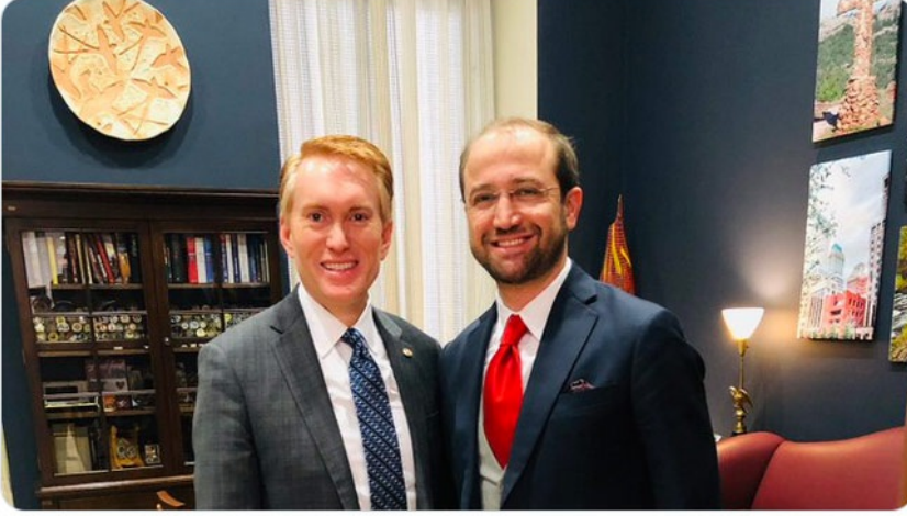
Sen. James Lankford

Good meeting @SenatorLankford on the #Hill today; enjoyed his company and the meeting — he's so smart and knowledgeable on foreign affairs!!!