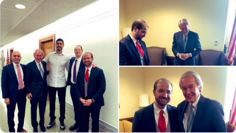
Ron Wyden ve diğer 3 kişi

Nice getting to know @SenMarkey today — and thanks to @RonWyden for the intro with him and hospitality at his office 🙏🙏