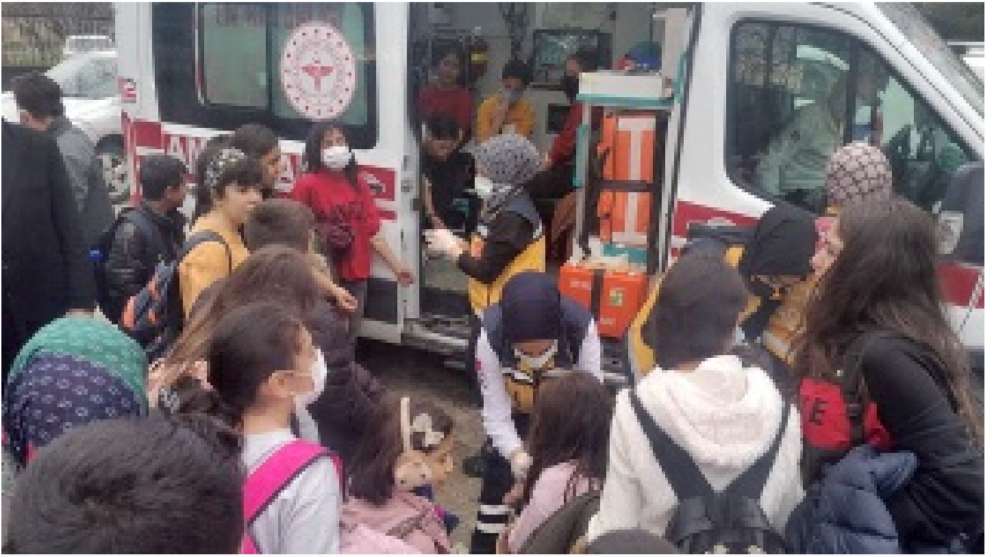
70 öğrenci hastaneye kaldırıldı