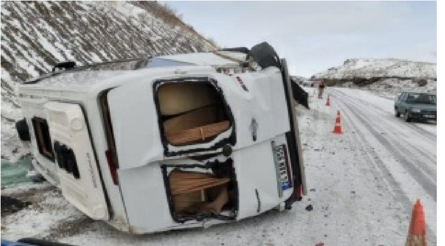
Erzincan'da devrilen minibsteki 8 kiři yaralandı