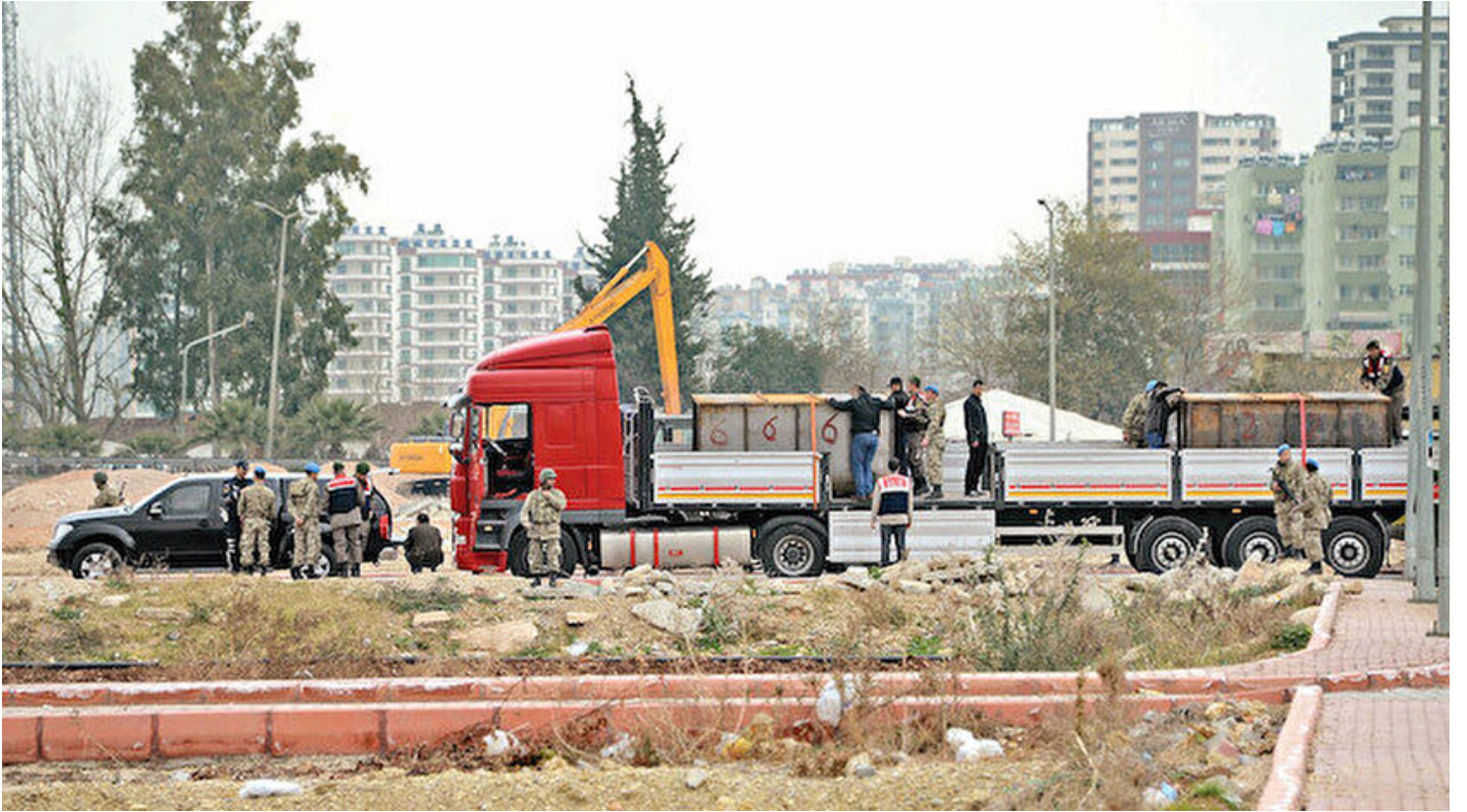
Vatana ihanette MİT TIR'ları perdesi

Haber Merkezi · 03 Mayıs 2019, 15:48 · Son Güncelleme: 03 Mayıs 2019, 15:58 · Yeni Şafak