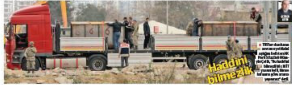
Haddini bilmezlik TIR'ları durdurma sürecinde MİT personeli gözaltına alındı. MİT personeli gözaltına alındı. MİT personeli gözaltına alındı. MİT personeli gözaltına alındı.

Suriye'nin görüşüleceği Cenevre 2 konferansında önce Türkiye'yi 'teröre yardım eden ülke' gibi göstermek isteyen örgüt, Hatay'dan sonra Adana'da düğmeye bastı. Ankara'nın 'sevkiyat devlet sırrı' uyarılarına aldırmayan jandarma bölge komutanı ve savcı, MİT'e ait 3 TIR'da arama yaptırdı. MİT personeli gözaltına alınmak istendi.