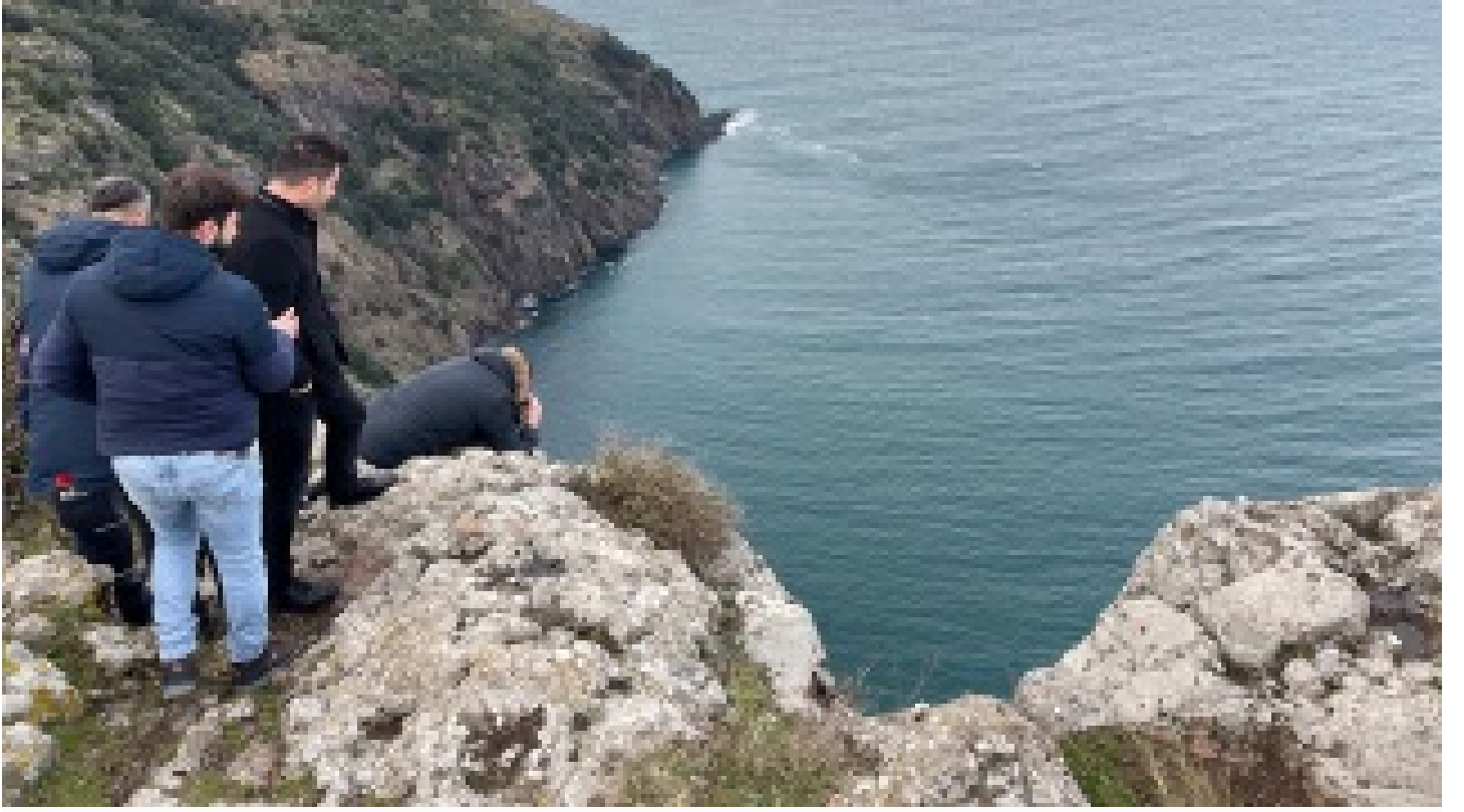
Sinop'ta uçurumda kadın cesedi bulundu