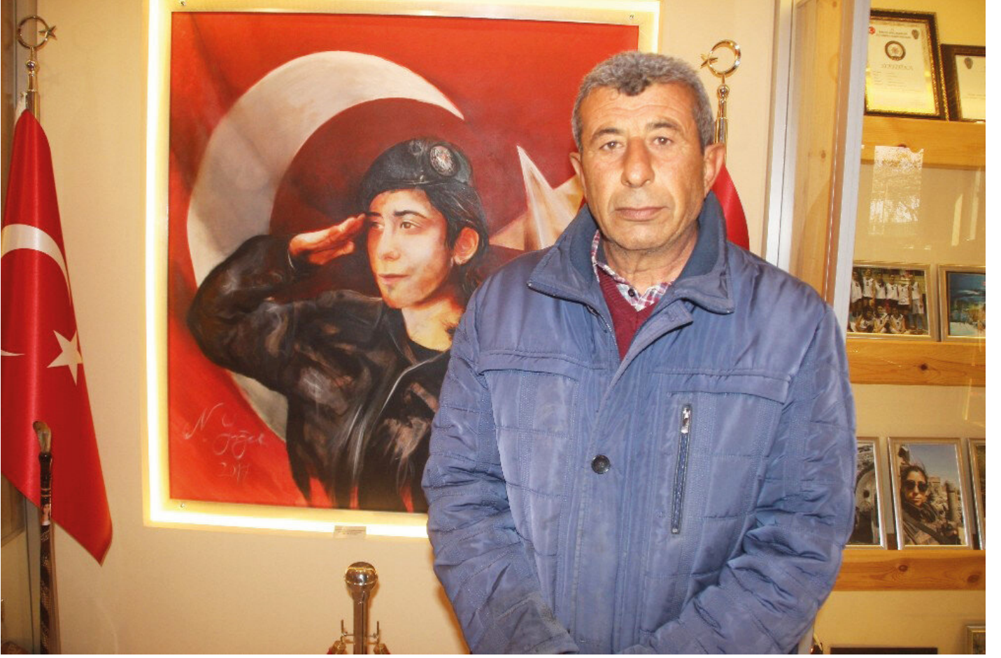
Yahya Kemal Yiğit