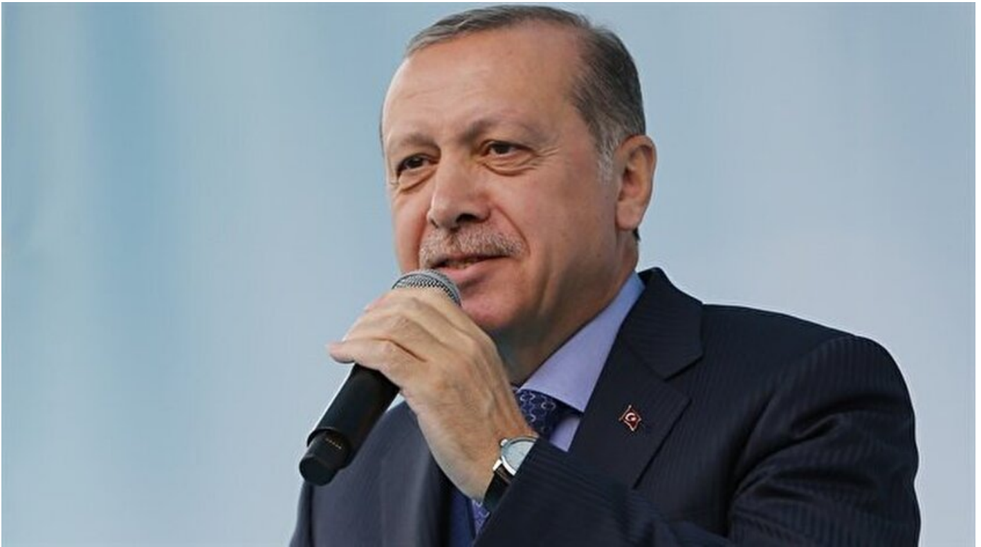
Cumhurbaşkanı Recep Tayyip Erdoğan