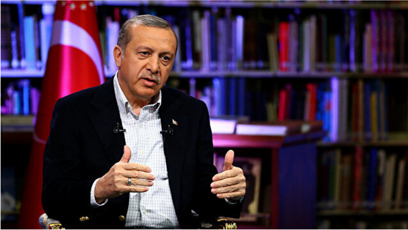
Cumhurbaşkanı Recep Tayyip Erdoğan