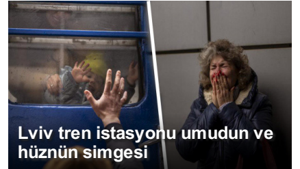
Lviv tren istasyonu umudun ve hüznün simgesi