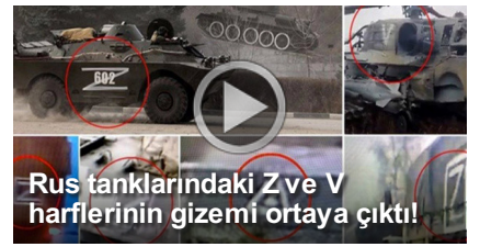
Rus tanklarındaki Z ve V harflerinin gizemi ortaya çıktı!