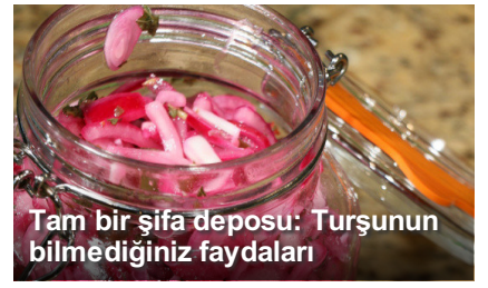
Tam bir şifa deposu: Turşunun bilmediğiniz faydaları