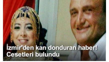
İzmir'den kan donduran haber! Cesetleri bulundu