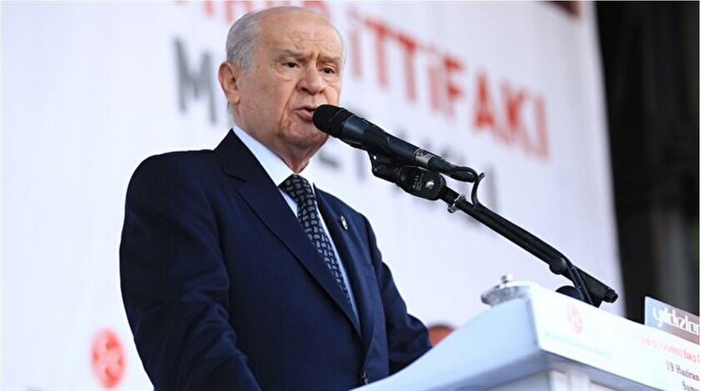
MHP Genel Başkanı Devlet Bahçeli

Haber Merkezi · 20 Haziran 2018, 23:55 · Son Güncelleme: 21 Haziran 2018, 09:18 · AA