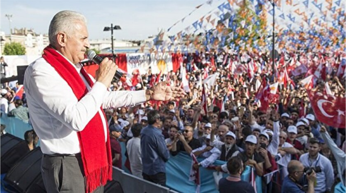
Başbakan Binali Yıldırım

Haber Merkezi · 16 Haziran 2018, 19:32 · Son Güncelleme: 16 Haziran 2018, 19:35 · AA