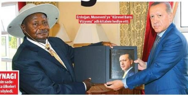
Erdoğan, Museveni'ye "Küresel Barış Vizyonu" adlı kitabını hediye etti.

■ Museveni, Türkiye'nin liderliğinin sadece Uganda için değil, diğer Afrika ülkeleri için de ilham kaynağı olduğunu söyledi.