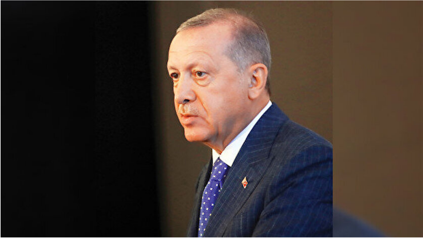
Recep Tayyip Erdoğan