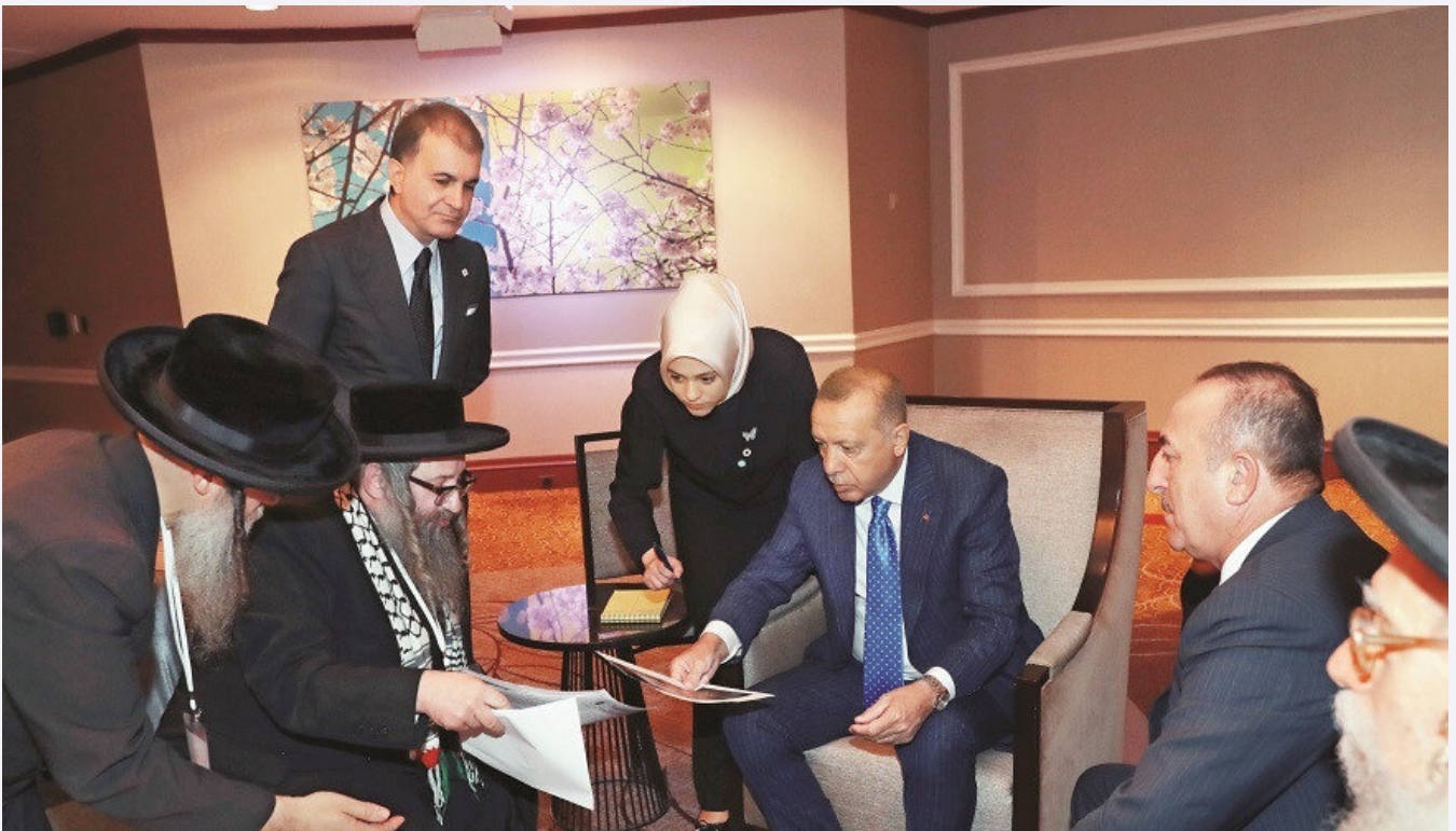
Siyonizm karşıtlarını kabul etti

New York şehir nüfusunun yarısı kadar Suriyelinin Türkiye'de ağırlandığını belirten Erdoğan, "Kirli bir savaşın kurbanı olan milyonlarca Yemenli kardeşimiz için de insani yardım çalışmalarımızı sürdürüyoruz. Gelişmiş ülkeler sırtını dönse de biz mazlumlara sırtımızı dönmeyeceğiz" dedi. Erdoğan, "Birileri istemese de gazeteci Cemal Kaşıkçı'nın, Mısır Cumhurbaşkanı Muhammed Mursi'nin hakkını aramaya devam edeceğiz" diye konuştu.