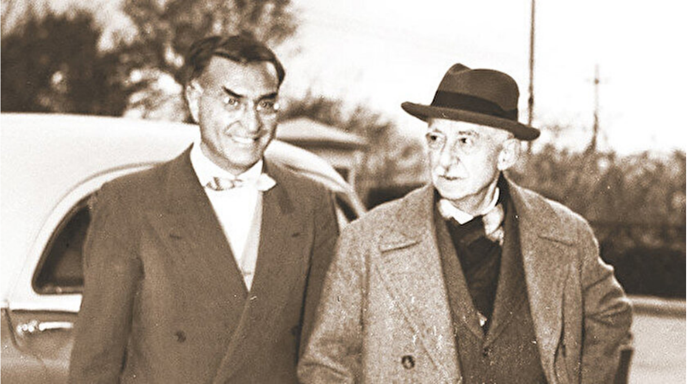
Kasım Gülek ve İsmet İnönü

Haber Merkezi · 20 Ocak 2020, 03:30 · Son Güncelleme: 20 Ocak 2020, 11:40 · Yeni Şafak